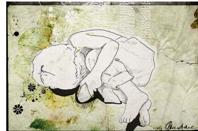
Proyecto FEM2012-33067: Maternidad, tecnología i relación asistencial

Aulario Campus de Ciencias de la Salud de Bellvitge 22 a 24 de Mayo de 2014