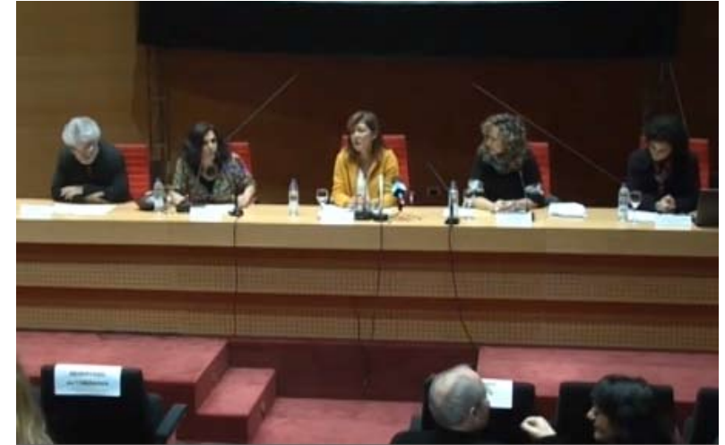
Imagen de la sesión de apertura