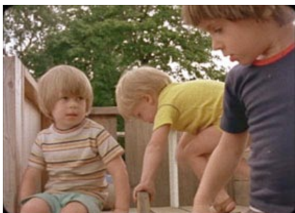
Guzzetti, A. (1980) Scenes from Childhood EUA. 78 min.

A pesar de que en muchas películas aparecen niños y niñas como protagonistas, muy pocas reflejan la vida entre ellos desde su punto de vista.