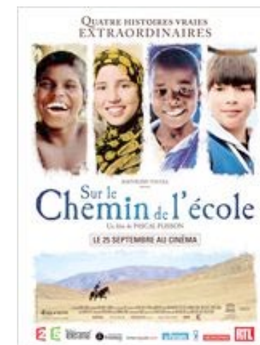
Plisson, P. (2013) Sur le chemin de l'école Francia. 77 min.

Documental sobre las clases de filosofía para niños y niñas de parvulario, que promueven la reflexión sobre nuestra capacidad ética, social y humana, y sobre la importancia de una buena educación desde la infancia. Los niños y niñas, que tienen entre tres y cuatro años, exponen libremente, con sus emociones y contradicciones, durante la hora de filosofía, sus ideas sobre el amor, la libertad, la inteligencia, la muerte, etc.