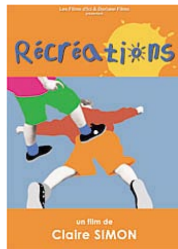
Simon, C. (1992) Récréations Francia. 95 min.

Es un documental donde se muestran fragmentos de escenas cotidianas en las que los protagonistas son un grupo de niños y niñas de 3 a 5 años. En esta filmación podemos ver cómo se relacionan entre ellos y cómo afrontan diferentes situaciones sin la presencia de adultos.