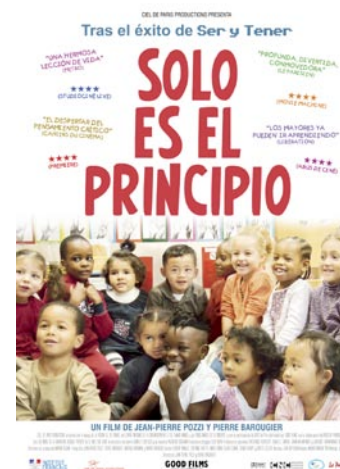
Pozzi, J.P. y Barouquier, P. (2010) Solo es el principio Francia. 98 min.

La autora de este documental grabó durante meses a niños y niñas en el patio de un parvulario francés, sin intervenir, con la intención de exponer las interacciones entre pares y cómo en ellas salen a la luz sentimientos y comportamientos de todo tipo.