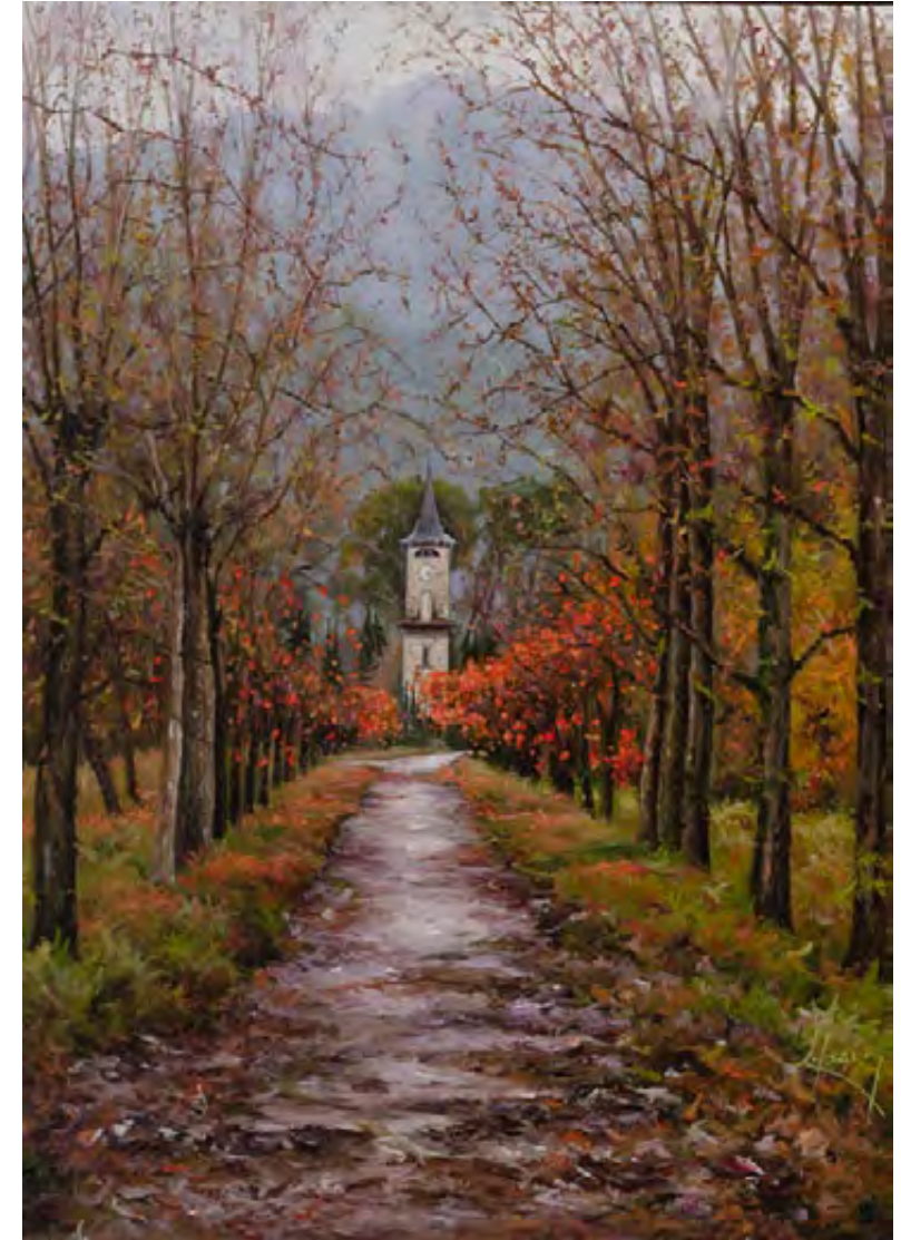
Colors de novembre vesteixen Banyoles 65 x 46 cm.

Las diferentes narrativas en torno al cuidado, la crianza y el trabajo doméstico que expondré a continuación, proceden de once padres de Catalunya 2 , residentes en Barcelona (7), Castellfollit de la Roca (2), Girona (1) i Granollers (1). Siete de los entrevistados tienen la custodia compartida de sus hijos y en cuatro casos, la custodia total. Cuatro de los entrevistados se separaron hace más de siete años, mientras que los otros siete se separaron hace menos de cinco años. Excepto en dos casos en los que los hijos o hijas en el momento del divorcio tenían un año de edad, la totalidad de los encuestados asumieron la responsabilidad del cuidado de sus hijos e hijas cuando éstos tenían, en promedio, 7 y 8 años. Actualmente, las edades de los hijos e hijas de los entrevistados oscilan entre los 7 y 18 años de edad.