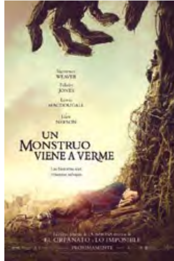
Bayona, Juan Antonio (dir.) (2016) Un monstruo viene a verme EE.UU./ España, 108 min.

Relato iniciático sobre Ari, un adolescente de dieciséis años quien tras haber vivido con su madre en Reykjavík, es enviado a los fiordos occidentales para vivir con su padre. Allí tendrá que lidiar no sólo con el hecho de que no tiene amigos, sino que además, la difícil relación con su padre hace del proceso de adaptación a su nueva vida, algo doloroso y complejo. En este ambiente desesperanzador, Ari deberá esforzarse para encontrar su camino, canalizar el sentimiento de abandono y fracaso en un entorno inhóspito. La película hace evidente los prejuicios, la represión de los sentimientos afectivos a familiares y seres queridos y lo que ello conlleva para las vidas de un padre y su hijo que acaban pareciéndose más de lo que ambos están dispuestos a asumir.