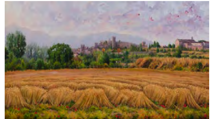
El blat daurat de les nostres muralles 130 x 60 cm.

En el testimonio de Marc, además del papel colaborador del abuelo, también es posible observar el importante papel que pueden cumplir los hijos e hijas en su propio cuidado. Este elemento está presente