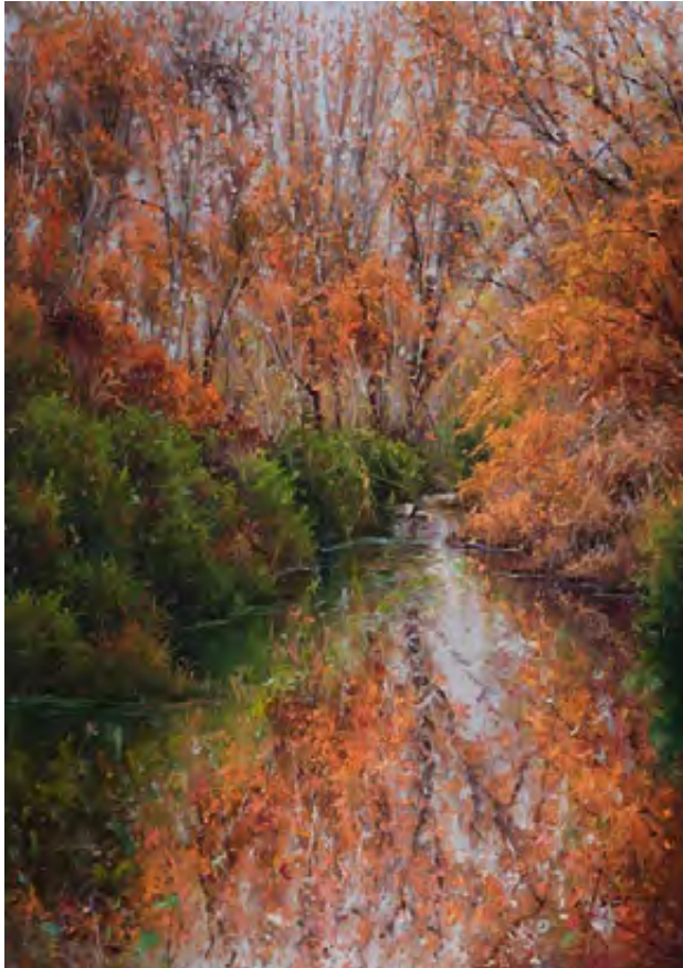
Des de Montblanc, la tardor ens il.lumina 65 x 46 cm.

la transmisión de valores, reglas y normas y la cobertura de necesidades físicas e intelectuales— se convierten en un elemento central que define la condición de ser padres especialmente definida por Marc: