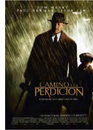
Mendes, Sam (dir.) (2002) Camino a la perdición EE.UU., 116 min.

Tras la separación de sus padres y la grave enfermedad de su madre, Conor O'Malley, un chico de doce años, tendrá que asumir la responsabilidad de llevar las riendas de la casa. Resultado de esta situación y del acoso escolar que sufre en el colegio, Conor ha creado un mundo de fantasía que le permite escapar de su rutina y con la ayuda de un monstruo que ha cobrado vida en la imaginación del niño, intentará superar sus miedos y fobias. Este drama fantástico está basado en el libro homónimo del escritor Patrick Ness y es él quien escribe el guión del film.