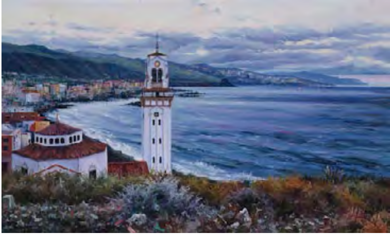
Anocheciendo en Candelaria 33 x 55 cm.

En términos sociodemográficos, el perfil de los entrevistados es heterogéneo: dos de ellos proceden de un nivel de renta media-alta, seis de un nivel medio y dos de un nivel medio-bajo. En cuanto al nivel educativo, cuatro tienen formación universitaria –Ingeniería (1), Administración de Empresas (1), Psicología (1), Sociología (1)–, cinco formaciones de grado medio y dos de ellos cuentan con formación básica.