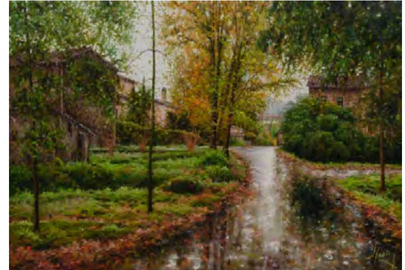
Grisos platejats d'octubre a la Moixina 65 x 92 cm.

Esta especialización de las tareas domésticas y de cuidado en el hogar podría ser entendida como resultado de determinadas condiciones sociales. Para muchos de los entrevistados, las mayores compli-