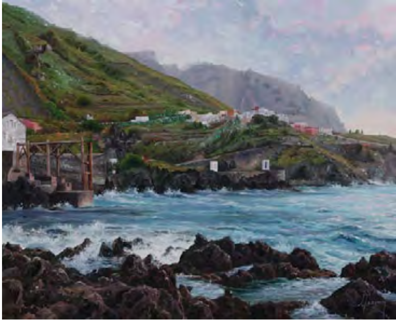
Azules de amor en Garachico 65 x 81 cm.

no mientras ella se viste. (...) La llevo al cole, la recojo del cole. (...) Cuando trabajo de noche, cenamos y la dejo en casa de mi padre (Marc, 42 años, empresario; cita original en catalán).