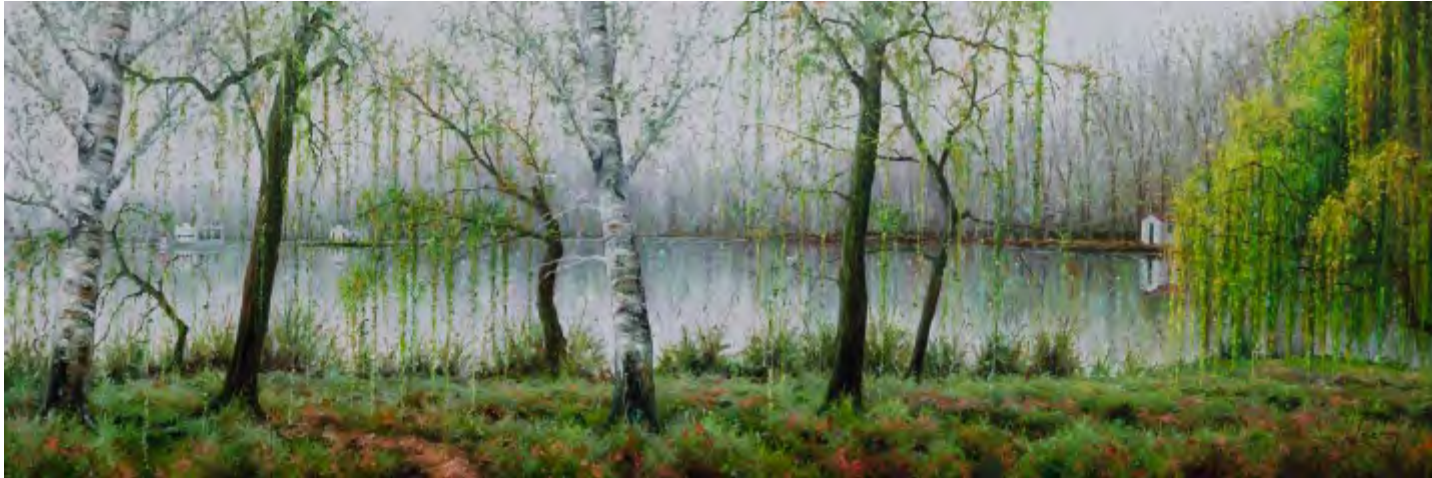
Els desmais de Banyoles ens mostren els seus verds 50 x 150 cm.