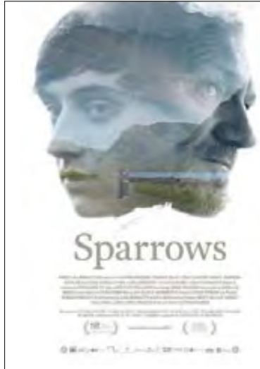
Rúnarsson, Rúnar (dir.) (2015) Sparrows (Gorriones) Islandia, 99 min.

Relato iniciático sobre Ari, un adolescente de dieciséis años quien tras haber vivido con su madre en Reykjavík, es enviado a los fiordos occidentales para vivir con su padre. Allí tendrá que lidiar no sólo con el hecho de que no tiene amigos, sino que además, la difícil relación con su padre hace del proceso de adaptación a su nueva vida, algo doloroso y complejo. En este ambiente desesperanzador, Ari deberá esforzarse para encontrar su camino, canalizar el sentimiento de abandono y fracaso en un entorno inhóspito. La película hace evidente los prejuicios, la represión de los sentimientos afectivos a familiares y seres queridos y lo que ello conlleva para las vidas de un padre y su hijo que acaban pareciéndose más de lo que ambos están dispuestos a asumir.