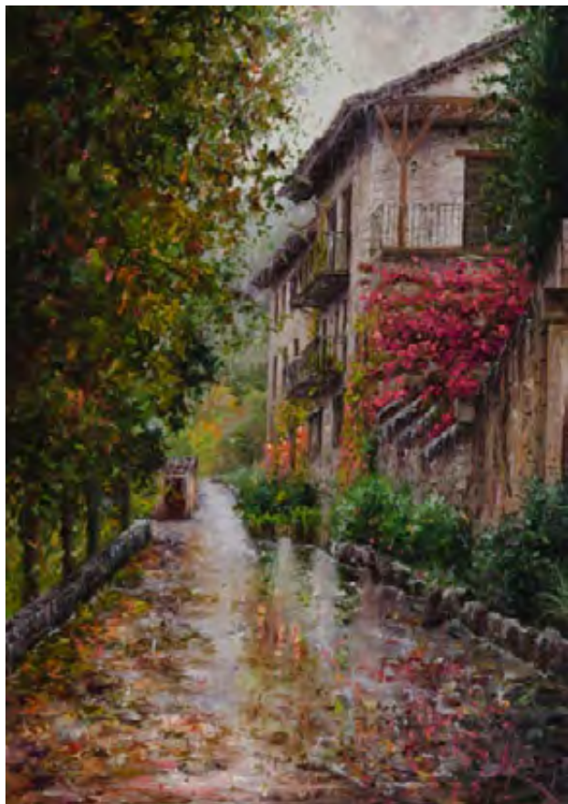
Plates de pluja a l'octubre 65 x 46 cm.

la madre. Sin embargo, algunas reflexiones de los entrevistados apuntaban hacia la necesidad de cambiar la mentalidad de los hombres y de la sociedad en general. El problema, no obstante, es que ven en el trabajo y en la escasez de políticas públicas, una seria limitación para conseguir