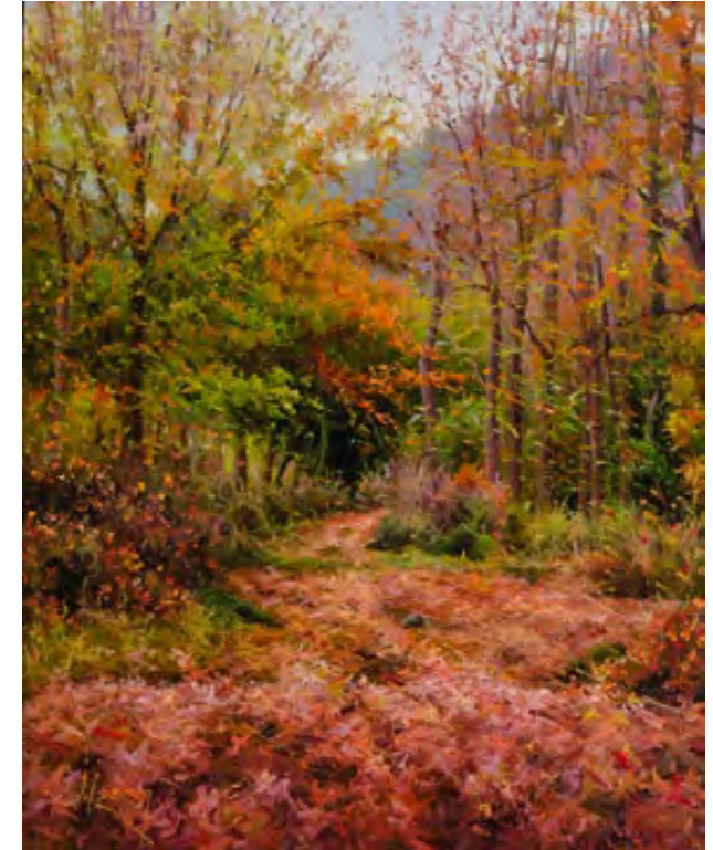
Camí tardorenc a la Vall de Campmajor 55 x 46 cm.

Por otra parte, en la mayoría de las entrevistas estaba presente la relación del concepto de ‘crianza’ con la transmisión de reglas, de normas de comportamiento, así como la importancia de proporcionar educación institucional y salud a sus hijos e hijas. Pero pese a estas diferencias entre ‘cuidar’ y ‘criar’, la mayoría de los entrevistados percibían ambos conceptos como interrelacionados en una especie de interdependencia entre dos términos claves en el desarrollo de la personalidad y del carácter de las personas. De hecho, para algunos entrevista-