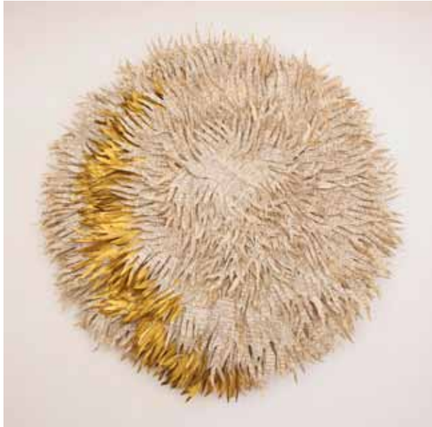
Campo semántico II

la casa familiar, dado que su padre, como hemos señalado con anterioridad, no parecía aceptar que su hija iba creciendo y que las normas de la infancia no sirven para la adolescencia, en la que es necesario redefinir las relaciones. Para ella la relación con su pareja “[va] muy bien, yo empecé con diecisiete, él con dieciocho, claro. Yo era un año menor, pero bueno, bien. La relación súper bien. [...] Llevamos juntos un año y siete meses, “que los vamos a cumplir el 24 de agosto” [...] Me ha ayudado en todo...”.