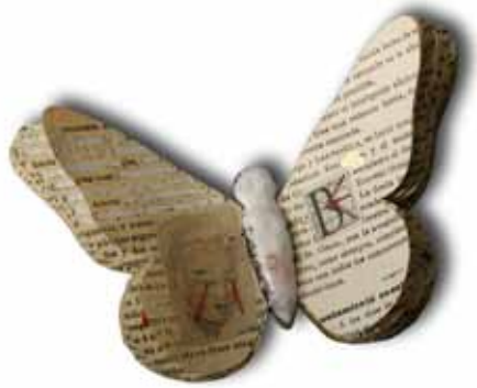
Libro de artista