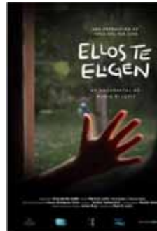
Levit, M. (2015) Ellos te eligen Argentina, 62 min