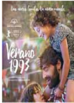
Simón, C. (2017) Verano 1993 España, 97 min