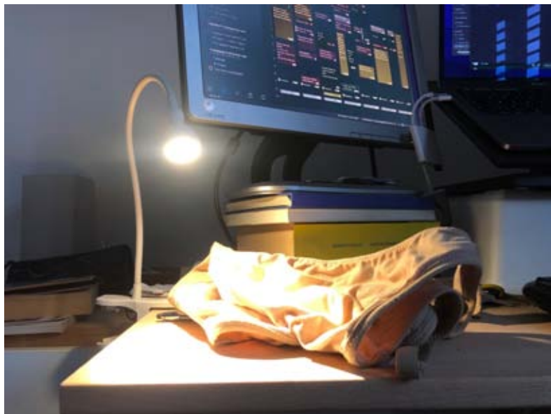
Meetings sin bra.

des políticas y legales que experimentan. Al carecer de redes familiares se apoyan en redes de sus comunidades: las emprendedoras haitianas, por ejemplo, han creado una comunidad propia encapsulada en su cultura, que impacta, a su vez, en las dinámicas urbanas de Tijuana y Mexicali.