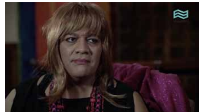
Irigoyen, A. (Director) (2017) Historias debidas VIII: Susy Shock [Documental] Argentina, 58 min

Trabajaron como prostitutas o peluqueras, pero ahora son abogadas, defensoras de derechos humanos, modelos, estudiantes universitarias y hasta servidoras públicas. A pesar de los estigmas, las mujeres transgénero siguen avanzando en su lucha por la inclusión laboral y social en Colombia.