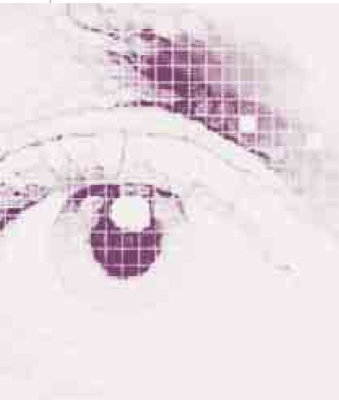
Mirades a la televisió: Gran Angular

Aquest dijous, a les 12 hores, comença un nou cicle, Mirades a la televisió: Gran Angular , a la Sala Cinema de la UAB - Centre de la Imatge, ubicat a la Plaça Cívica. Durant tres sessions, i fins el 3 d'abril, es projectaran tres documentals produïts pel programa televisiu Gran Angular de TVE Catalunya.