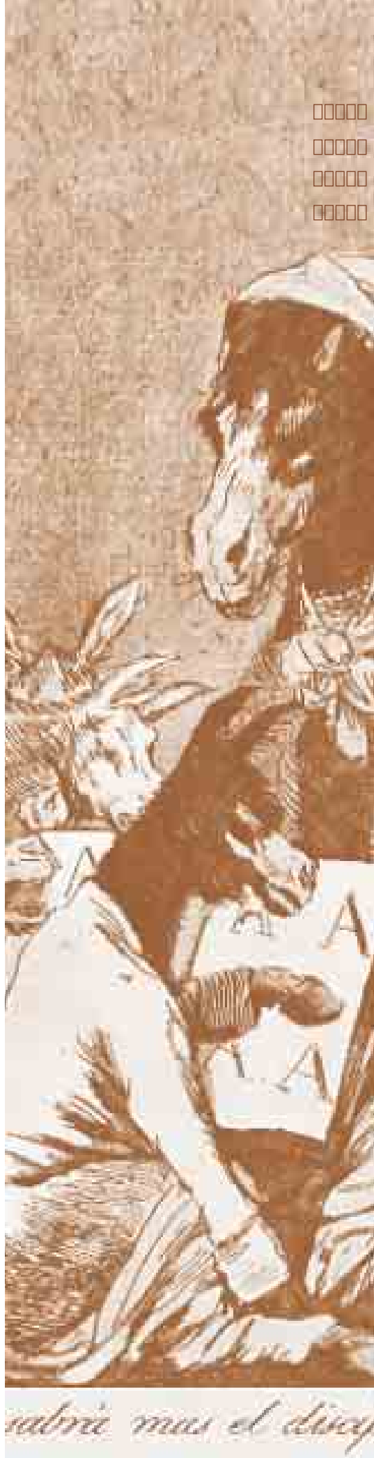
Francisco de Goya: 'Si sabrá más el discípulo'

fragments d'una carta de comiat llegits per gèolegs, nova lectura del cicle "la ciència a l'escenari"