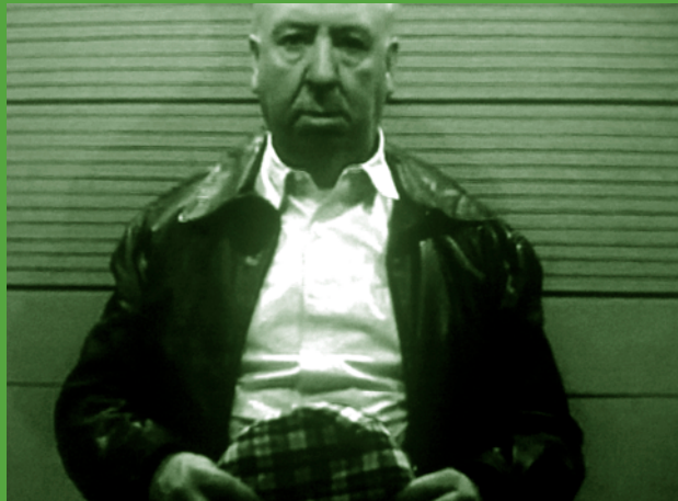
"Double Take" (Johan Grimont, 2009)