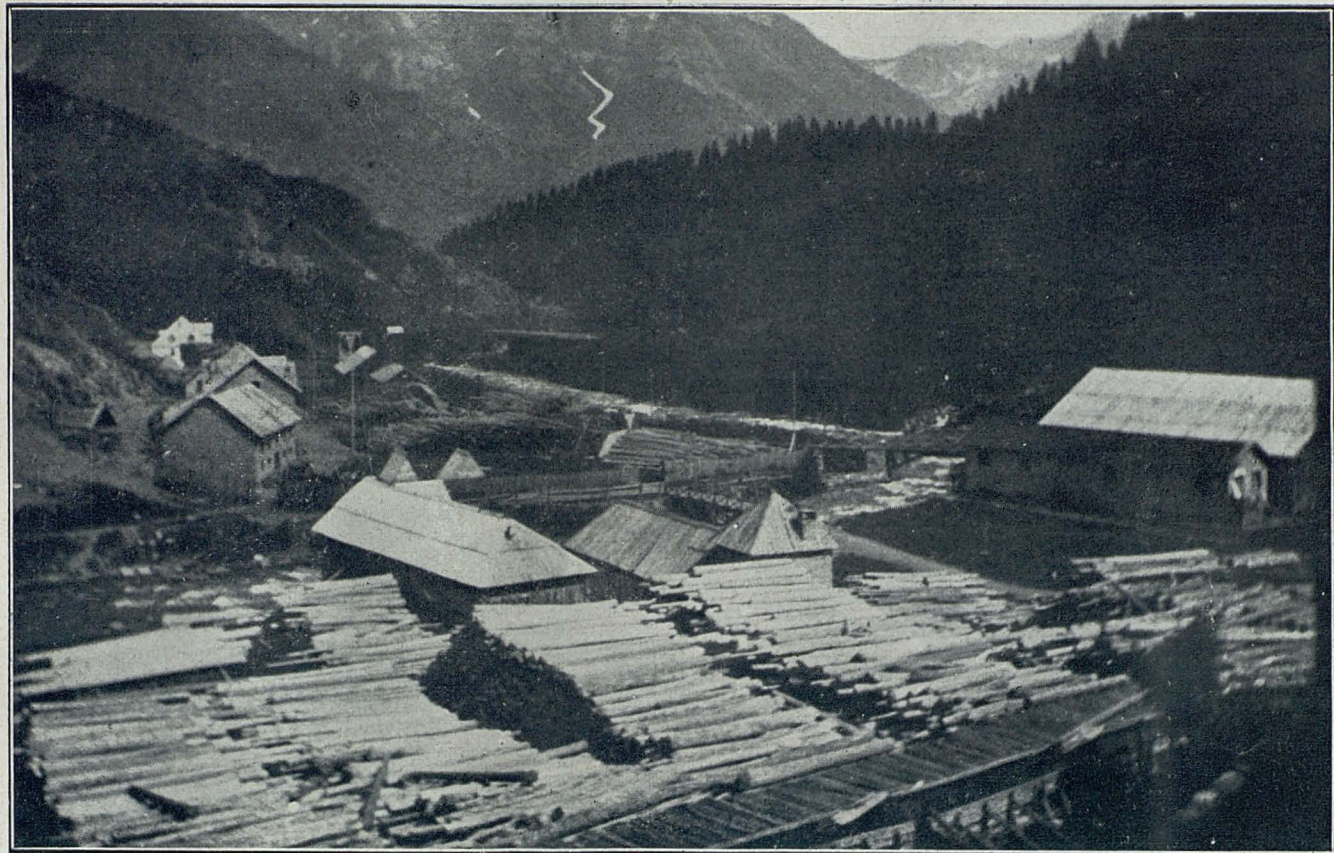
Serreria que, ja fa alguns anys, tala els boscos de Bonabé, convertint en erms una de les més belles encontrades de la nostra terra