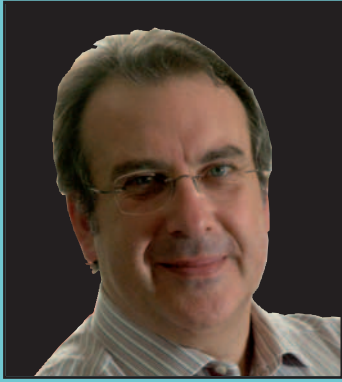
Josep Cuní Cuní pregunta, preguntes a Cuní (19.04.2007)