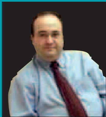
Miquel Iceta Els dies de Govern (22.04.2007)