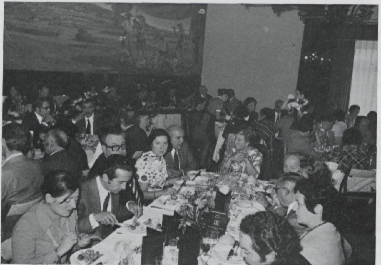
Otro aspecto de la misma.