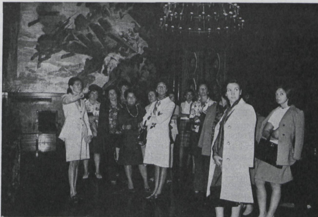
Las esposas de los congresistas en una visita al Ayuntamiento de Barcelona.