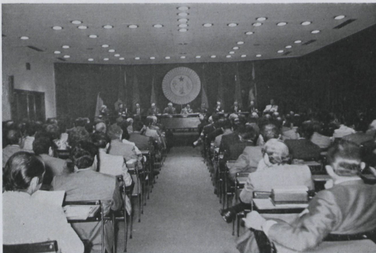
Un aspecto del salón de Sesiones.