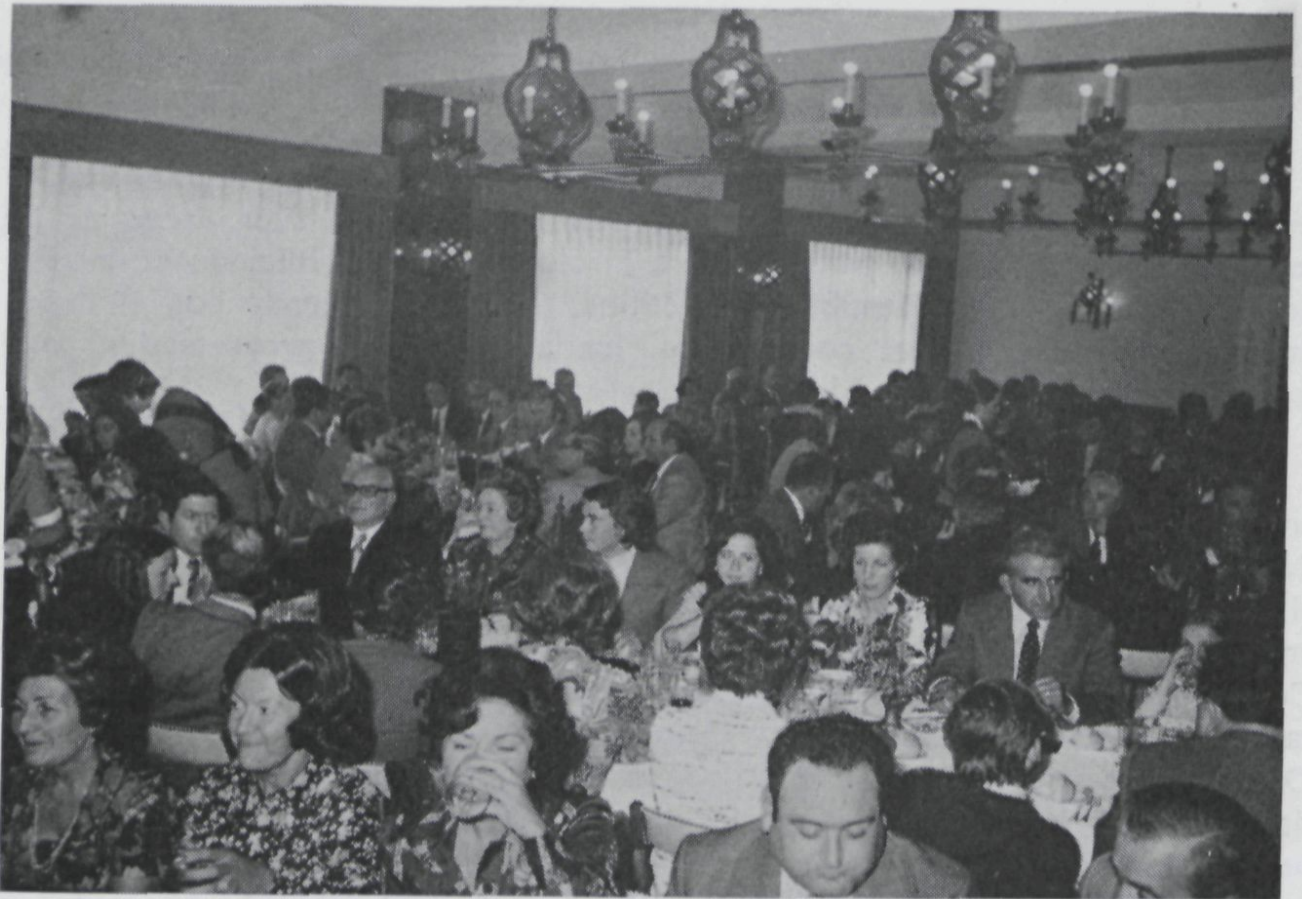
Aspecto parcial de la comida de Hermandad.