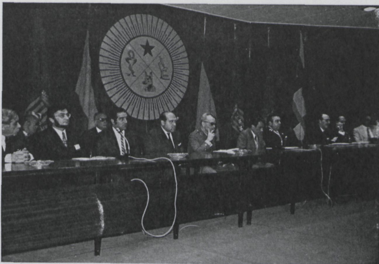
Mesa Inaugural del XIV Simposio Regional de los Colegios de Cataluña y Baleares.