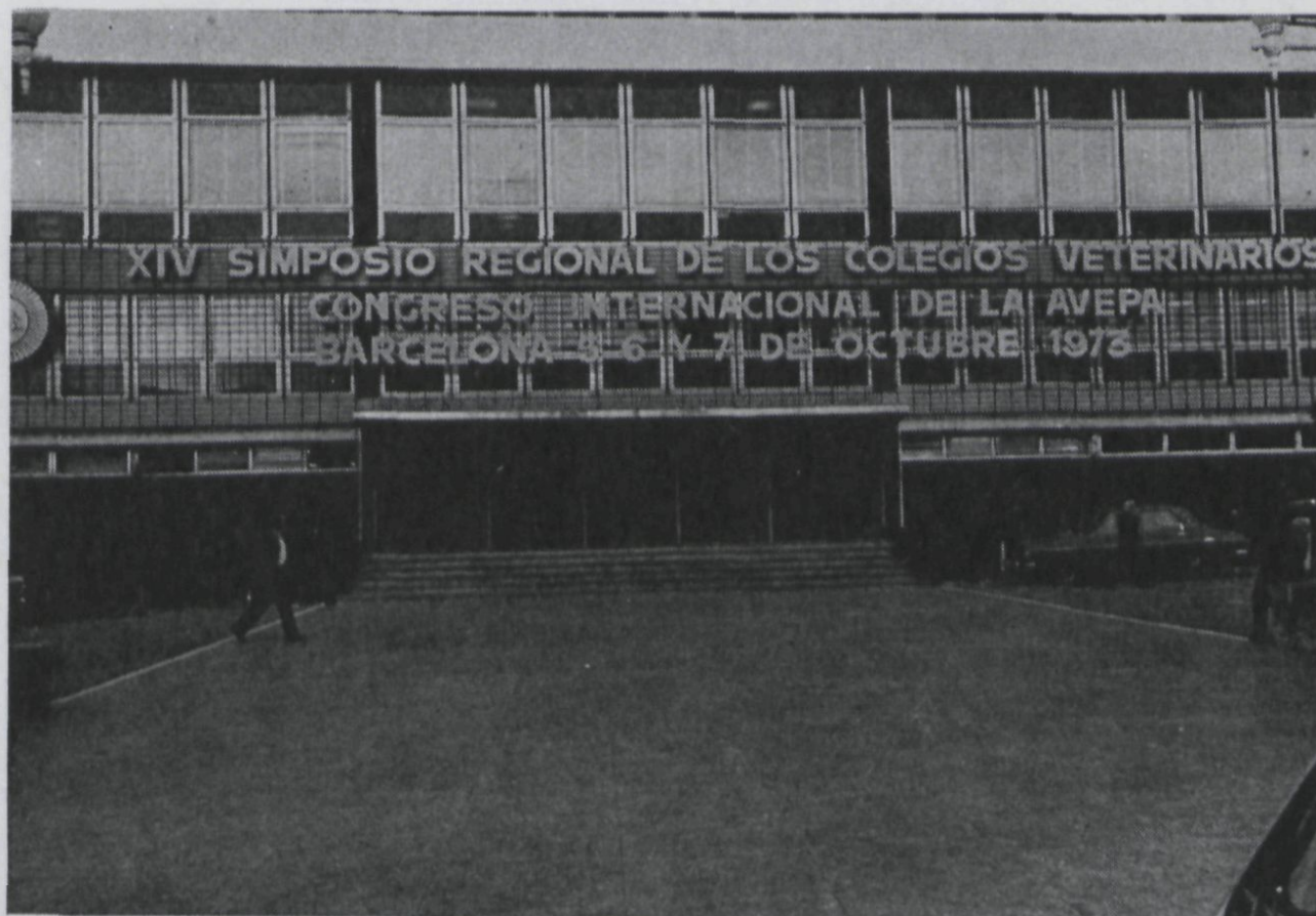
El Palacio del Congreso con motivo del Simposio.