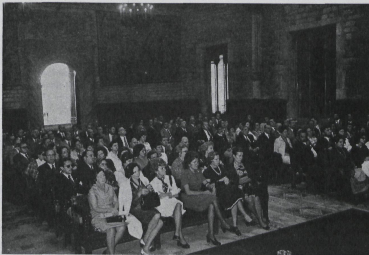
El Salón de Ciento durante el vino de honor, ofrecido por el Consistorio Municipal.