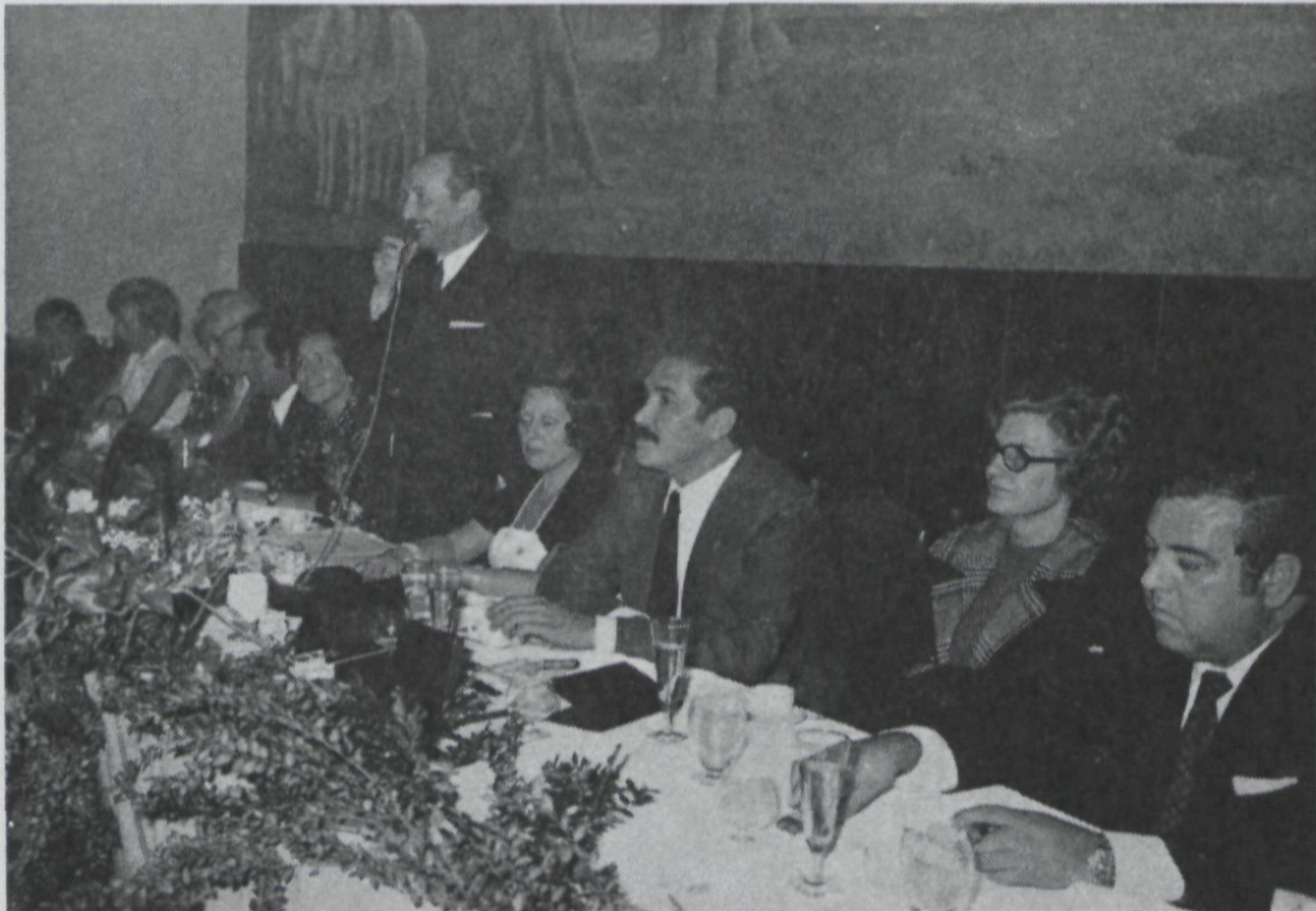
Presidencia del Acto.