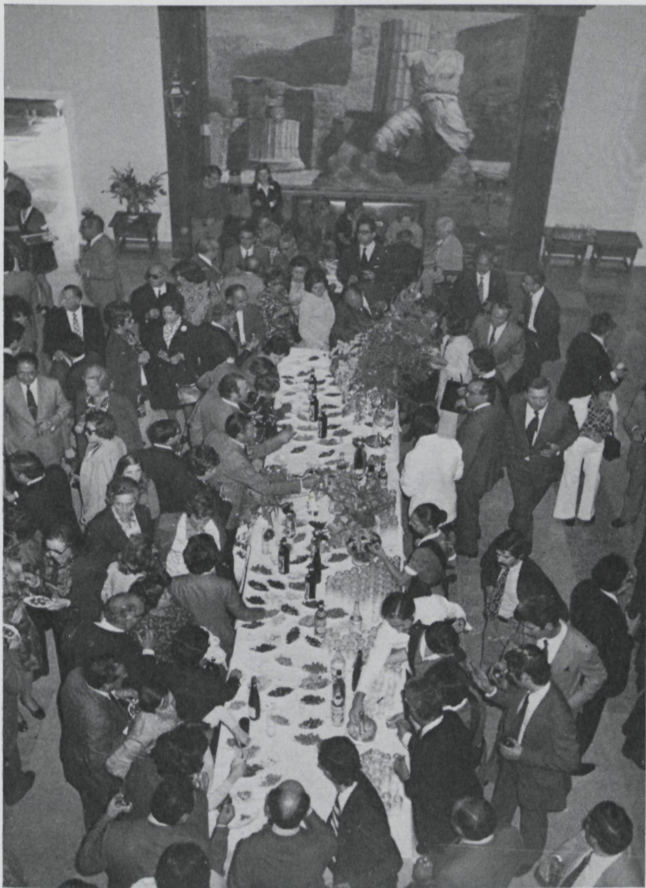
Salón donde se sirvió el aperitivo.