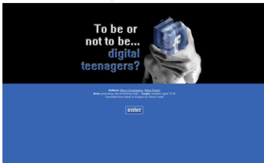
FIGURA NÚM. 2 - PÁGINA PRINCIPAL DE “¿SER O NO SER... ADOLESCENTES DIGITALES?”

Por otra parte, el módulo educativo tiene también como objetivo el promover la creatividad de los estudiantes y su capacidad para crear productos digitales de acuerdo con sus propias lengua y gramática. El enfoque en los distintos medios se basa en una aproximación transversal a la cuestión de la comunicación digital.