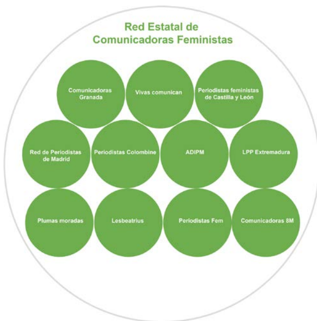
Figura 1. Integrantes de la Red Estatal de Comunicadoras Feministas

Para la recolección de los datos se acude a la revisión bibliográfica documental, que permitió el análisis y la construcción del corpus teórico y contextual de la investigación, así como a la entrevista en profundidad para conocer la estructura organizativa derivada de las LPP. Se realizaron un total de 11 entrevistas a las representantes de las redes territoriales que se han constituido en la Red Estatal de Comunicadoras Feministas (figura 1). Este criterio de selección se justifica en que dicha red constituye la entidad organizativa que agrupa de facto a las comunicadoras españolas tras la huelga del 8M de 2018.