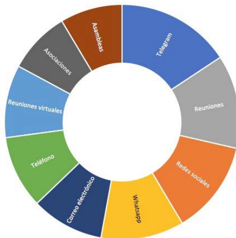
Figura 2. ¿Qué herramientas participativas se emplearon tras la huelga del 8M de 2018 para que las profesionales de los medios de comunicación siguieran conectadas y articuladas?

La constitución de esta estructura y de sus formas de organización, sobre todo a nivel territorial, ha estado mediada por el empleo de herramientas participativas (figura 2), como el uso de Telegram, las redes sociales, las reuniones físicas, el WhatsApp, el teléfono, el correo electrónico, las reuniones virtuales, las asambleas, etc.