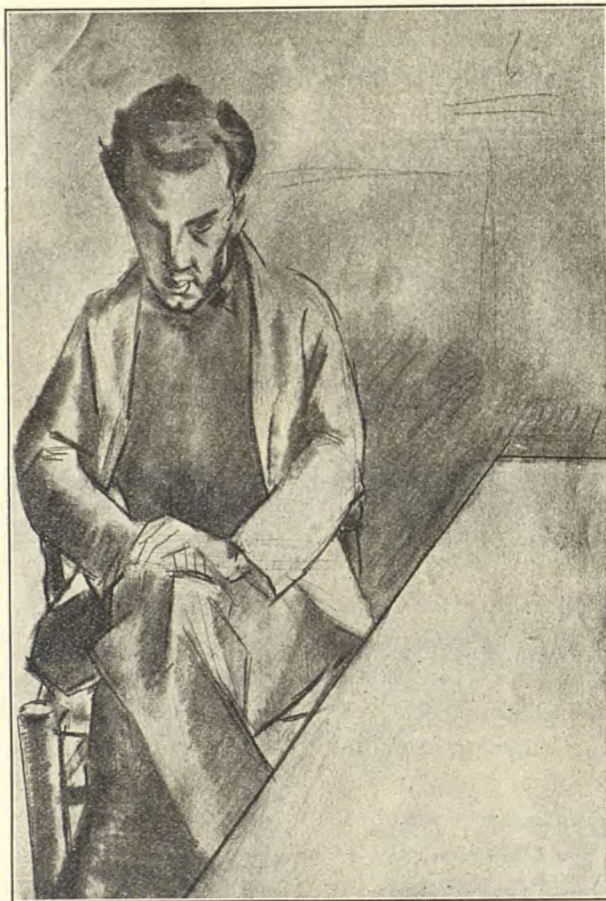
Dibuix de MANOLO

Quan a mí, sempre he sentit frenats els meus impulsos bestials per aquest no sé què d'ancestral que porto dintre. I és, potser, perquè ho porto ben arrelat que he seguit essent un home de bé, em sembla, fins en els ambients més coriòmputs. D'altra