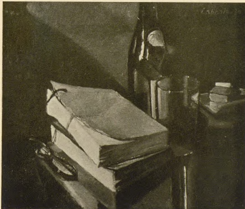
FRANCESC LABARTA Natura morta Exposició: Grup de «Les Artsi els Artistes»