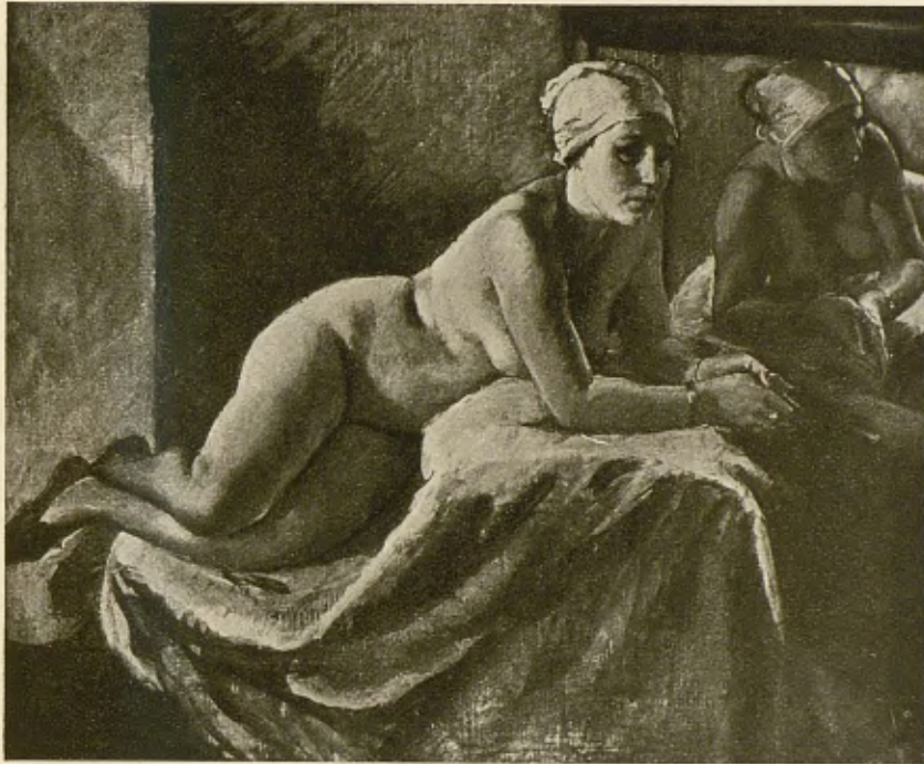
FRANCESC LABARTA Nu Exposició: Grup de «Les Artsi els Artistes»