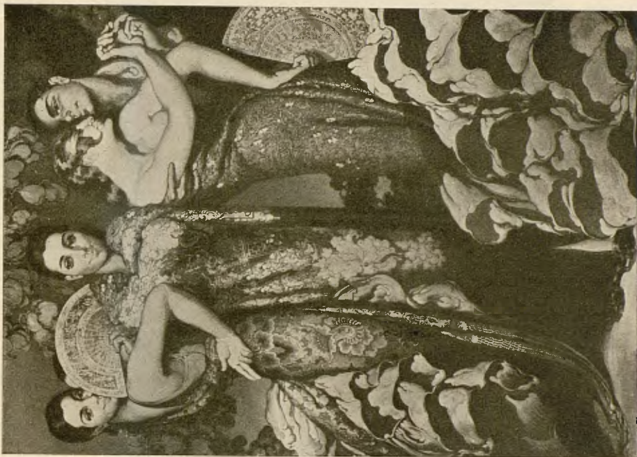
Nestor. Recvelta . Exposició: «Sala Barcino»