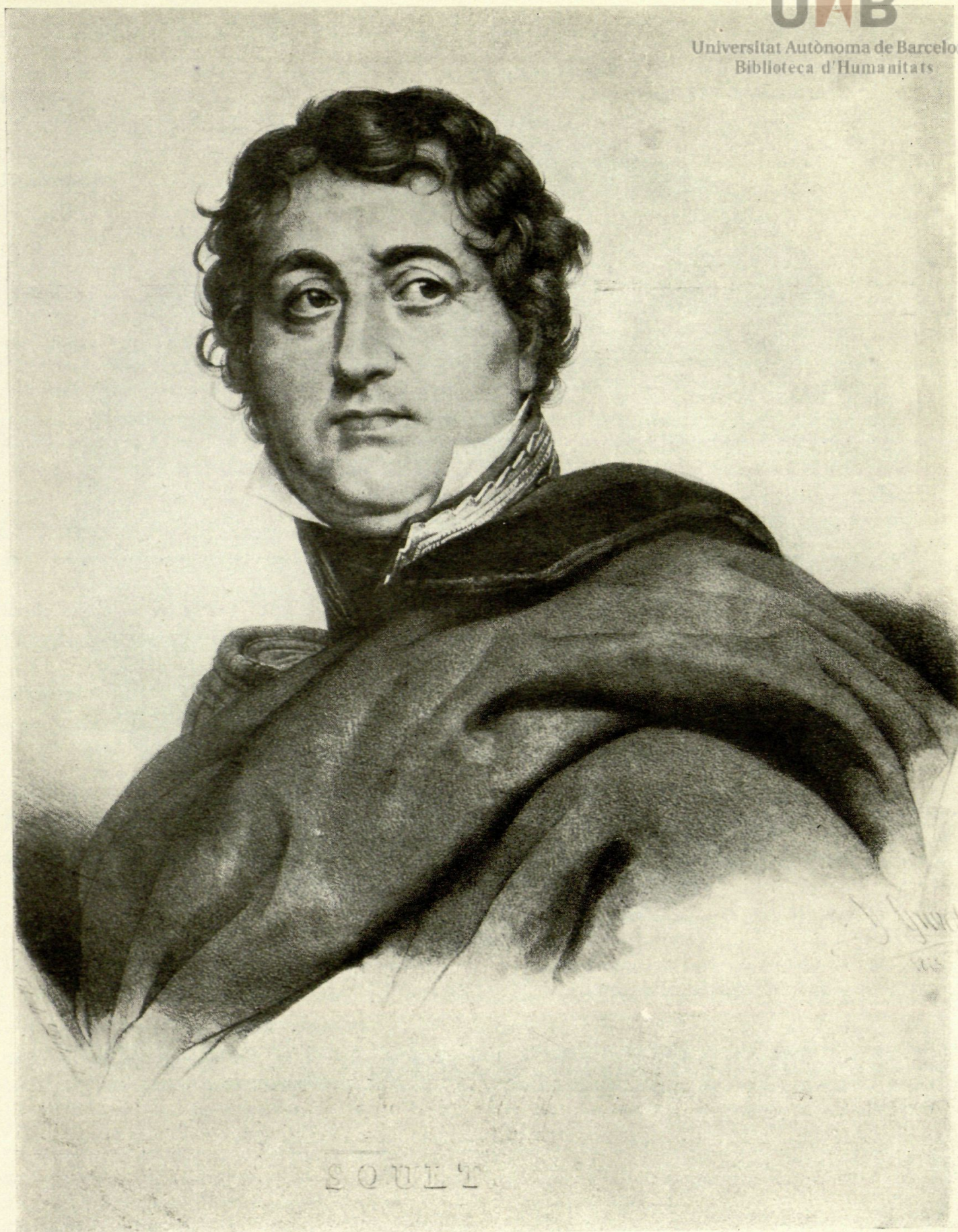
El General Soult.