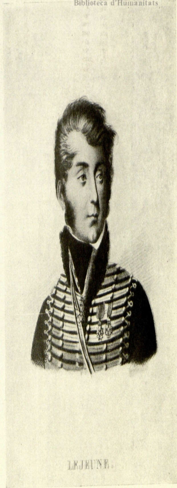
El General Lejeune.