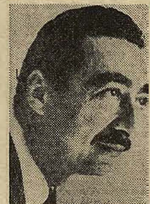
M. DE PEDROLÓ