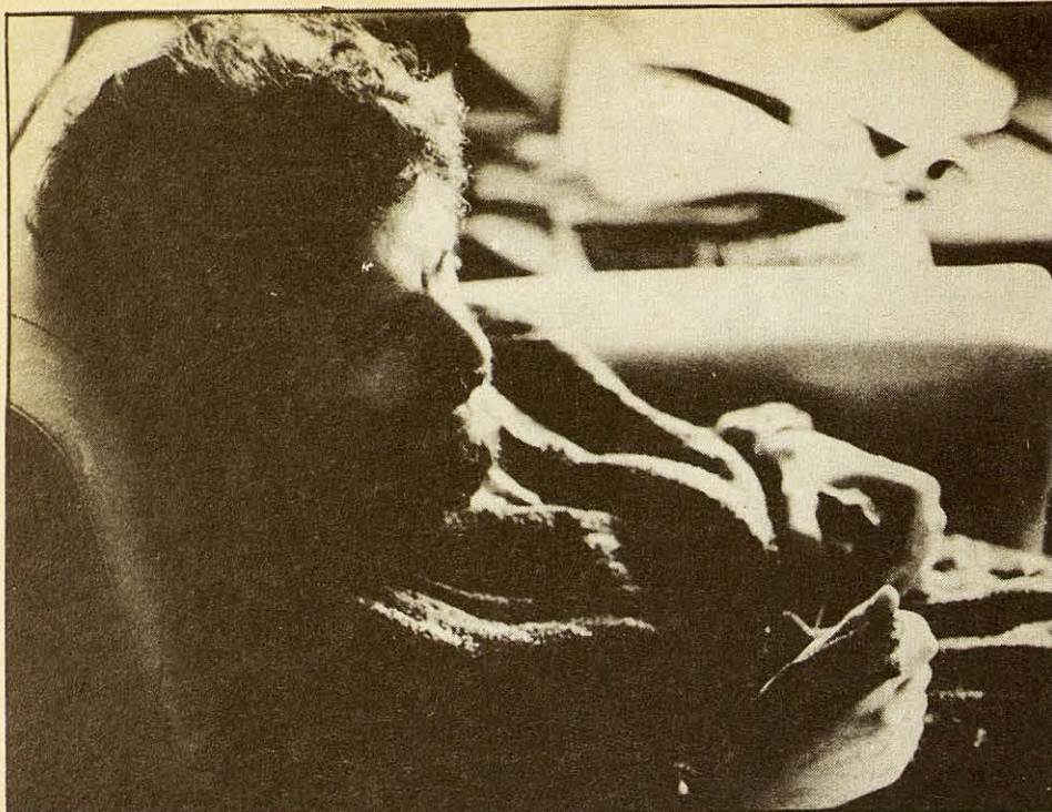
En Joan no estava gaire d'acord amb la manera com funcionava el món cultural català.

ELS FEUS SÓN LA BASE (estudi morfològic i funcional dels peus dels infants)