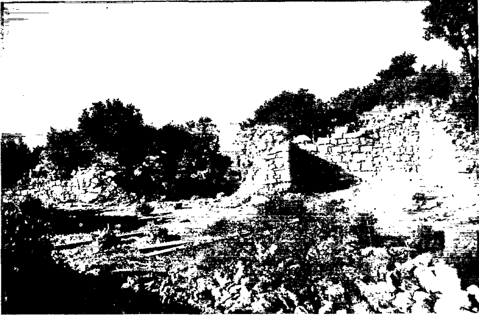
Figura 1: Vista parcial de la muralla ibèrica d'El Turó del Montgròs. En primer terme hom pot veure la porta amb el doble parament de l'esquerra i el baluard de la dreta. També a la dreta, s'aprecia el costat sud d'una torre pesudotrapezoidal.