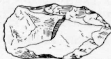
LS qq 601