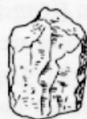
LL qq 614