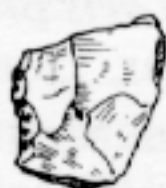
LL qq 142