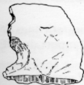
LL qq 586