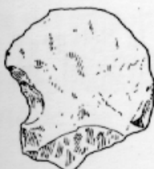
LS qq 580