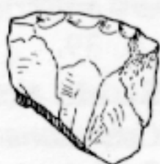
LL qq 636