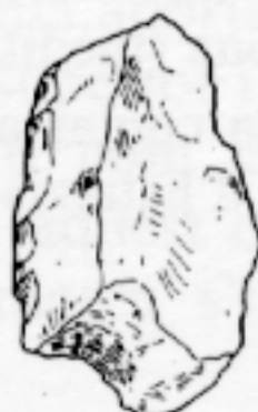
LS qq 480