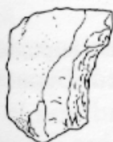
LL qq 606