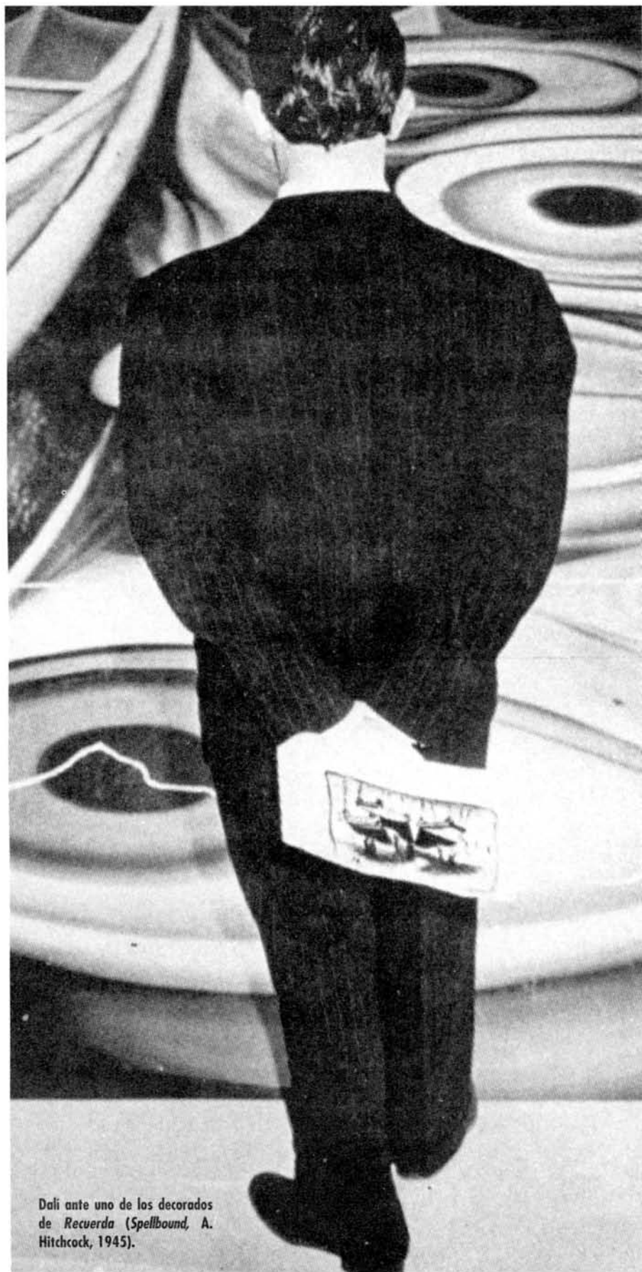
Dalí ante uno de los decorados de Recuerda (Spellbound, A. Hitchcock, 1945).

na d'una dona de cutis blanquíssim, que no em deixava viure. N'era conscient, de la naturalesa psicopatològica, i per altra part totalment apolítica, d'aquells rampells. Fins al punt que mentre va durar la meua passió per Hitler em va semblar que per fi gaudia d'un autèntic estat de bogeria”.