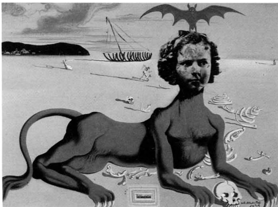
Shirley Temple el monstruo sagrado más joven del cine de su tiempo.

pintat Gullem Tell amb el rostre de Lenin..."