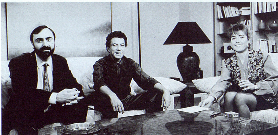
QUADRE 2. Temps dedicat a cada gènere en la programació emesa en horari d'òptima audiència (de 9 a 11 del vespre)

Font: Elaboració pròpia amb dades de TV3