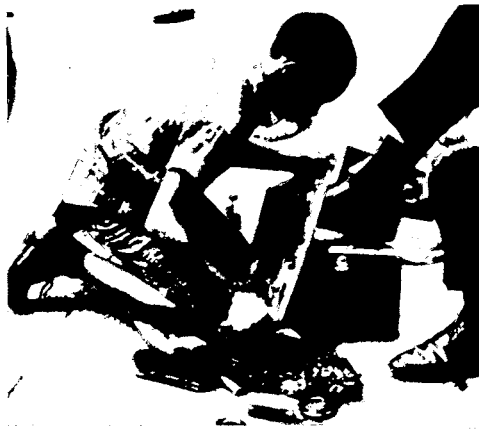
El racisme: una actitud en vies d'extinció? Noi netejant sabates a un carrer de Sud-àfrica.