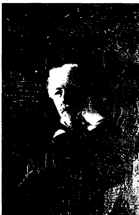
Joseph Arthur, comte de Gobineau. Biblioteca Nacional i Universitària d'Estrasburg

Però les darreres descobertes de la genètica han ofert la possibilitat de donar un contingut més objectiu al concepte de raça, i considerar-la com un conjunt d'individus que tenen en comú una part important del seu patrimoni genètic, és a dir, de característiques intrínseques als diversos grups humans, independentment de les seves condicions de vida