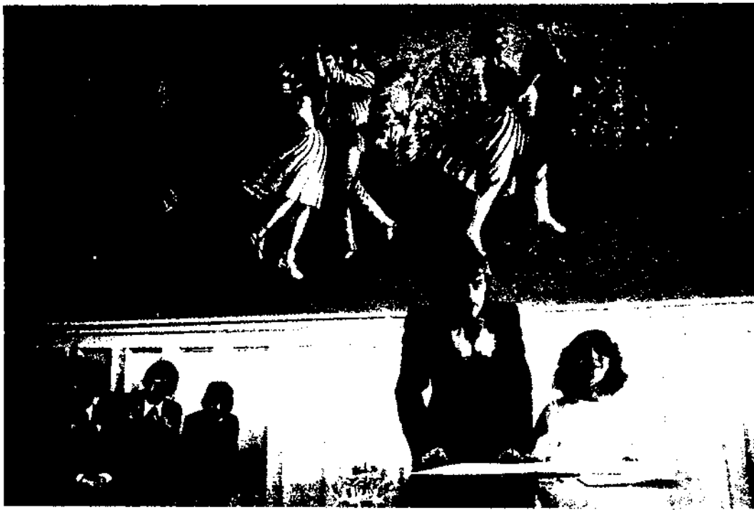
Avui s'assisteix a la il·lusió d'un retorn al «model tradicional» de família. Fotografia: Matrimoni. França. Fons Unesco. Núm. 73 (1995), pàg. 17.

o divorciats i un 2,49 per a les dones separades o divorciades de la mateixa edat. El major nombre de dones separades i divorciades que d'homes en la mateixa situació indica clarament la major propensió dels homes a contraure segones núpcies, o, per ser més exactes, la dificultat que poden trobar les dones divorciades amb descendència a contraure segones núpcies, pauta que s'observa anteriorment per al cas de les vídues.