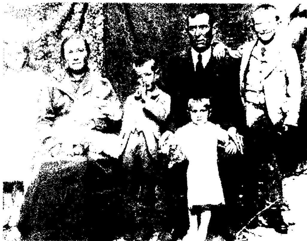
El model de família tradicional s'està buidant ràpidament dels seus continguts a causa de circumstàncies com: la individualització, l'entrada masiva del mercat en les llars, el treball de la dona, l'atur, etc.

Els fills, per la seva banda, pateixen sovint les conseqüències d'aquest baix perfil institucional de les noves famílies. L'escassa definició de partida comporta una labor de construcció que requereix uns esforços i unes energies que amb