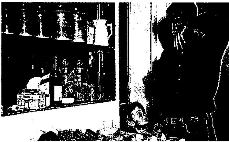
La desinstitucionalització de la família fa que l'home s'hagi de replantejar el seu paper en el nou esquema familiar. Fotografia: Florence Paradis. Sans titre, 1993. A: El Guia. Núm 3 (1994), pàg. 44.

molta freqüència els pares i les mares es veuen obligats a dedicar a lluites exteriors. Tanmateix, el que necessiten els fills petits i el que esperen rebre dels adults són orientacions clares i segures, valors sòlids, normes de comportament, tot allò que precisament la desinstitucionalització de la família està fent summament fluid i bellugadís. Si resulta que tot és negociable segons les correlacions de força respectives, les bases del seu ordre personal poden esdevenir força inestables. Igualment, no crec que afavoreixi gaire la formació dels nens la tendència d'alguns pares a posar-se al seu nivell i voler ser els seus amics. El que els cal als fills no són uns iguals, sinó uns superiors.