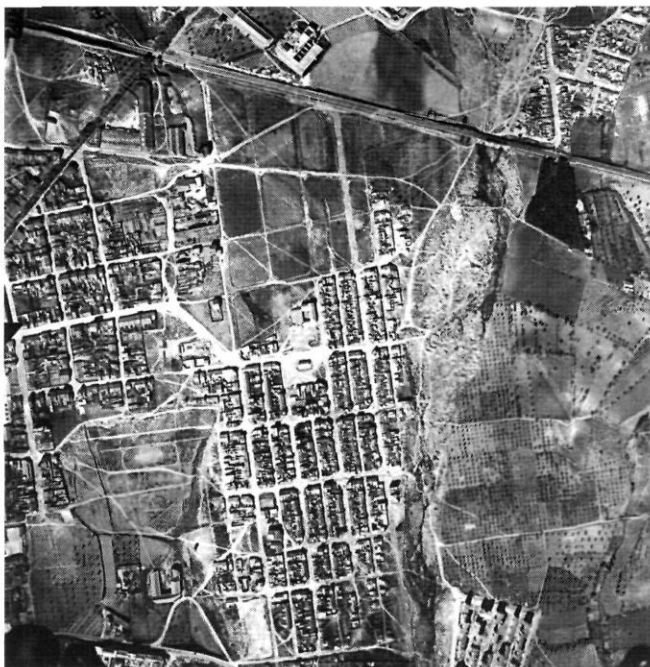
Ca n’Anglada 1958.

La població que arribà a Catalunya d’arreu de l’Estat espanyol, al llarg de la segona meitat del segle XX, s’instal·là als nous barris que –sense cap mena de serveis– nasqueren a totes les ciutats industrials de les comarques de Barcelona. Un d’aquests barris d’immigrants fets amb l’esforç dels seus veïns és Ca n’Anglada.