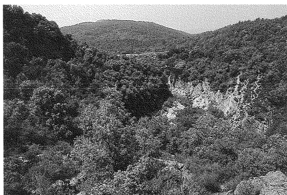
Fig. 1: Vista de la Vall del Llerca (La Garrotxa). El yacimiento de la Bauma del serrat del Pont se encuentra al lado del puente románico.

situables cronológicamente en el intervalo temporal correspondiente al neolítico. Si bien éstas se encuentran aún en curso de estudio, presentamos en este trabajo, de forma preliminar, una primera aproximación a su caracterización.