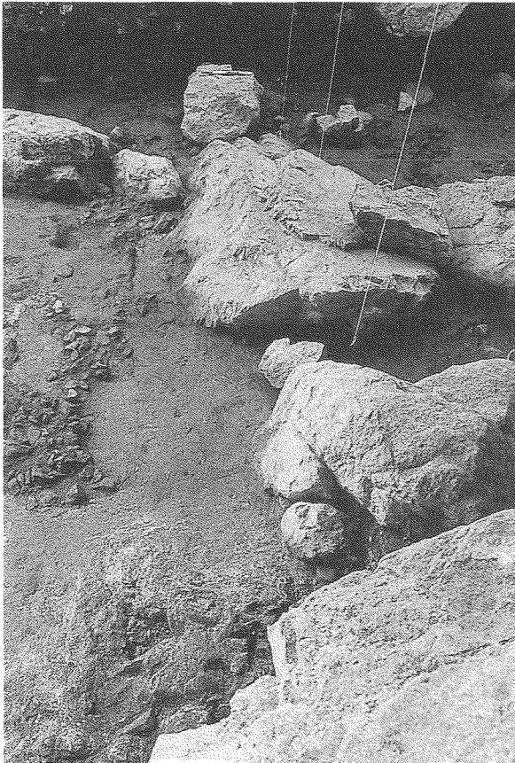
Fig. 3: Detalle de la estructura construida por bloques para delimitar el espacio de hábitat. Nivel III.4 (Neolítico Antiguo.)