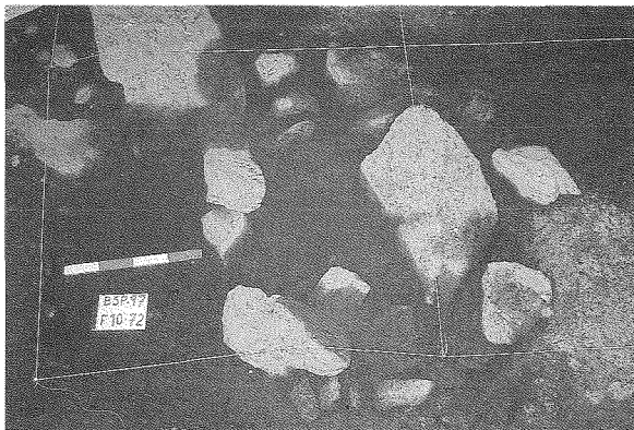
Fig. 4: Detalle de la fosa excavada de planta circular. Nivel III.4 (Neolítico Antiguo.)

sideración dada la abundancia de estructuras domésticas, y de manera particular el área de combustión extensa y la estructura de almacenamiento-mantenimiento, nos indicaría