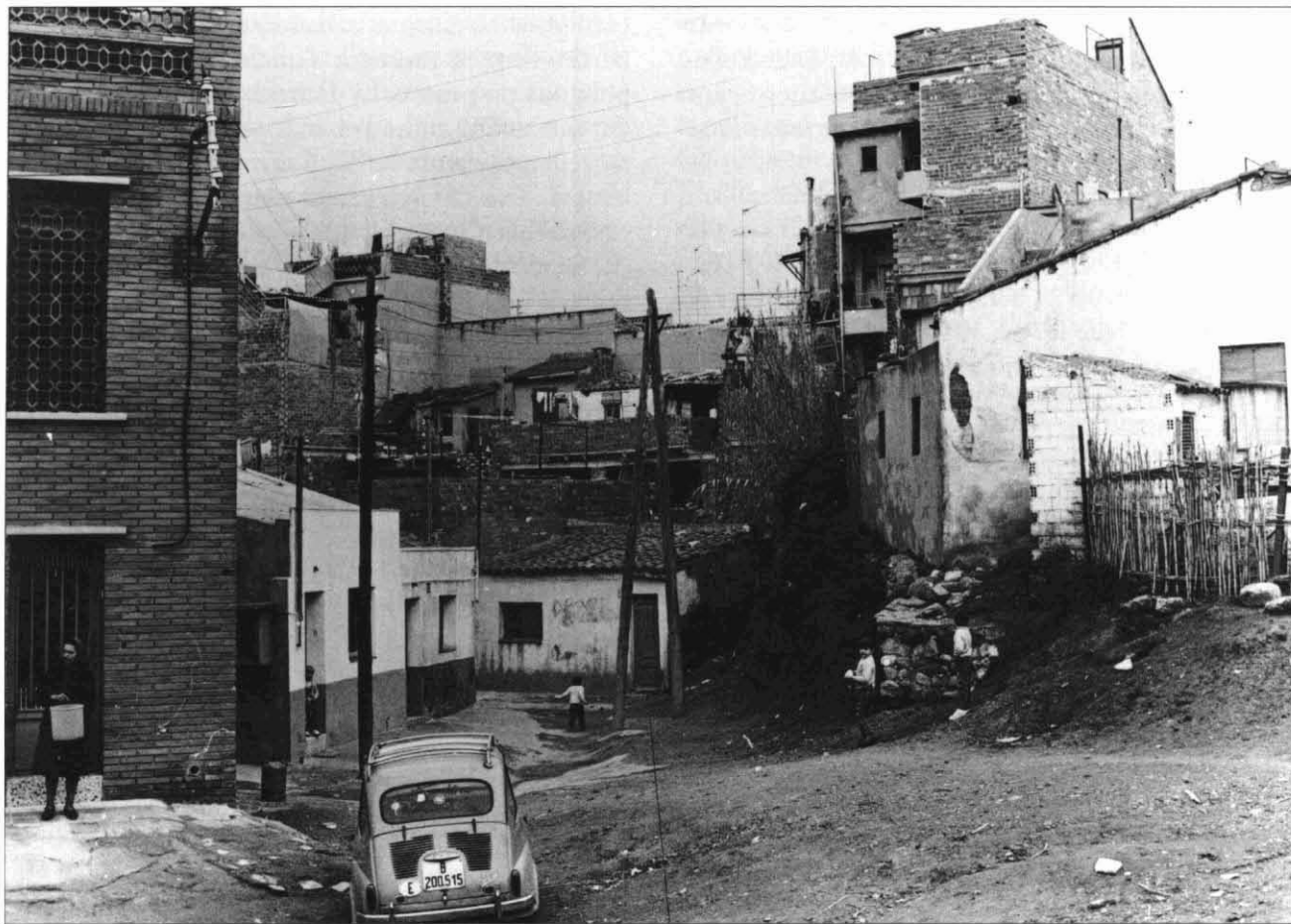
FOTOGRAFIA 1. La millora de les condicions urbanístiques va ser un dels primers eixos de treball del moviment veïnal. [s.a.]

Benaül subratlla l'heterogeneïtat de les associacions de veïns al llarg dels anys seixanta: n'hi ha que ja « tenían un carácter reivindicativo », d'altres que « eran puros centros de reunión social y limitada gestión de las urbanizaciones », i també les que « controladas por gente vinculada al Movimiento (...) llevaban una vida desconocida y desvinculada de los intereses del barrio ». 7