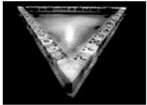
Fig. 2. The Dinner Party (1979).

Un conjunto de personajes históricos reales y mitológicos organizados en torno a una estructura narrativa muy clara: la primera mesa abarca a personajes desde la prehistoria hasta el mundo grecorromano, la segunda mesa incorpora a mujeres desde la época patristica hasta la reforma protestante y la tercera mesa recoge a diferentes figuras que vivieron entre los siglos XVII y XX. Nos encontramos, pues, con un total de treinta y nueve comensales compartiendo simbólicamente sus experiencias y reivindicando colectivamente sus derechos. Cada mujer habla por sí misma desde su propio horizonte vital pero, a su vez, sirve de correa de transmisión de las vivencias de todas aquellas mujeres que a lo largo de cinco mil años de civilización humana quedaron relegadas a un segundo plano. ¿Cómo dar testimonio de esos personajes sin historia? ¿Cómo rendirles homenaje? A tal efecto, Judy Chicago construye un suelo que, de nuevo, tiene una forma de triángulo equilátero y que está compuesto de novecientos noventa y nuevas pequeñas baldosas blancas y triangulares. En cada de una ellas se inscribe el nombre de alguna de esas mujeres menos conocidas que, en su conjunto, condensan una memoria colec-