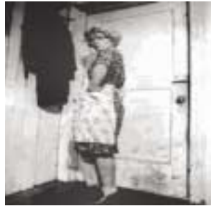
Fig. 9. Untitled Film Stills #35 (1978)