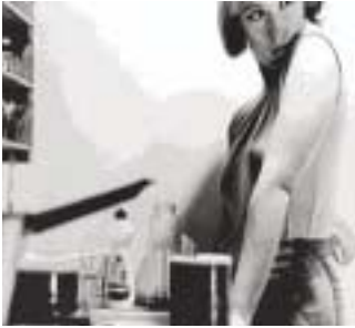
Fig. 8. Untitled Film Stills #3 (1977)

Al igual que sucediera en Untitled Film Stills (1977-1980), en la colección de Centerfolds (1981) o en Fashion (1983-1984), no interesa tanto la mujer en sí misma como la imágenes que reproducen el cine, la literatura o la publicidad sexista que destilan revistas como Vanity Fair o Play Boy . Ahí también se denuncian los estereotipos de un cuerpo femenino atractivo, sumiso y sensual expuesto a la mirada y a los deseos masculinos.