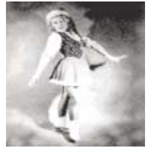
Fig. 10. Untitled Film Stills #228 (1980)

Desde la fotografía, entendida como una proyección del ojo, existen dos formas de constituir el cuerpo como objeto: o bien desde la lente masculina que sistematiza y racionaliza el cuerpo en términos de una máquina (Descartes o La Mettrie) que tiene que ser controlada y dominada por la razón; o bien desde el prisma de la ironía, de la mascarada, de la exageración que practica, por ejemplo, Sherman al invertir conscientemente el clásico modelo de pasividad femenina y al negar el presunto estatuto objetivo de las mujeres. De hecho, este comportamiento transgresivo como forma de realización personal está muy presente en autores como Oscar Wilde, Charles Baudelaire, Marcel Duchamp o Andy Warhol. Y en el caso de Claude Cahun y el Orlando de Virginia Woolf se adentra en los lindes del travestismo tan presente en el mundo del cabaret de los años veinte, desafiando el modelo victoriano de sexualidad monó-