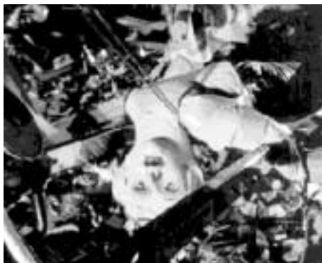
Fig. 7. Untitled #188 (1989)