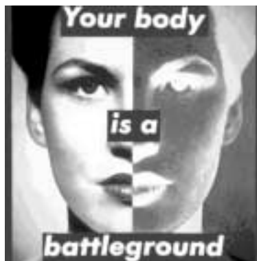
Fig. 12. Your body is a battleground (1989)

ganes publicitarios se plantean temas tan importantes como el aborto, la intolerancia religiosa, la violencia doméstica, el sexismo, el racismo o la libertad de expresión.