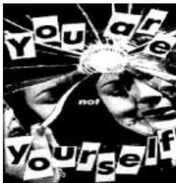
Fig. 11. You are not yourself (1982)