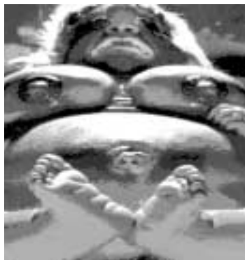
Fig. 6. Untitled #187 (1989)

El cuerpo, pues, se convierte en algo que ya no posee el aura de lo bello y lo sublime, sino que se transforma en su contrario, es decir, en lo obsceno, en lo impúdico, en lo degradante, en lo abyecto. Lo abyecto, provoca un estado de crisis y de repugnancia que perturba la identidad personal, que pone a prueba los límites de resistencia y tolerancia del orden social 21 . Sherman apuesta sin retóricas políticamente correctas por la capacidad de impacto de unas imágenes que reflejan las patologías de una sociedad del consumo incrustada en un paisaje de desconfianza y deshumanización. Como apunta Susan Sontag, «la cámara puede ser benigna, pero también es experta en crueldad» 22 . La visión fotográfica de Sherman permite ver la realidad social que todos ven pero consideran demasiado ordinaria para ser tomada en consideración. ¿Qué estrategia adopta Sherman ante este