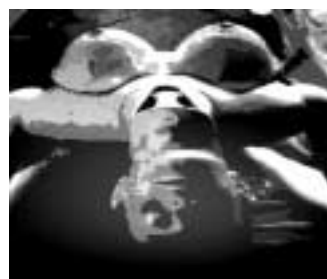
Fig. 3. Fairy Tales #157 (1985)