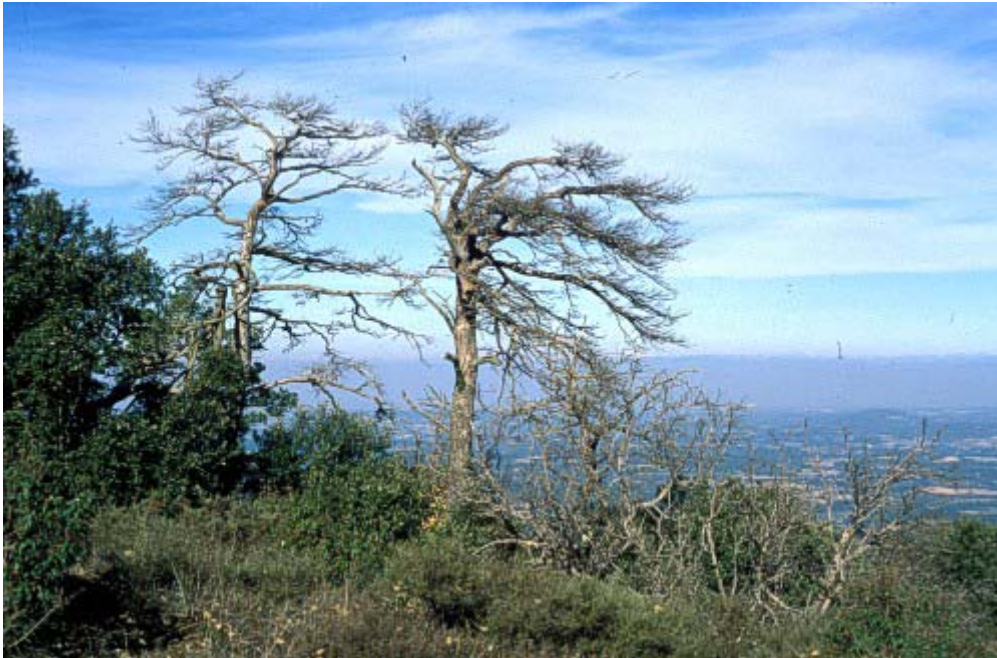
Foto 1. Fotografía de los efectos de la sequía de 1994 en una población de Pinus sylvestris de las montañas de Prades (Tarragona). La mortalidad en esta población fue de un 20%.

que limita esta resistencia. En este sentido, los efectos de los episodios recientes de sequía nos proporcionan información muy valiosa. La sequía de 1994, por ejemplo, causó mortalidades importantes en diversas especies leñosas en la Península Ibérica (Peñuelas et al. , 2001) ( Foto 1 ). Algunos estudios han mostrado que en algunas especies, como la encina ( Quercus ilex ) o el pino albar ( Pinus sylvestris ), los efectos de la sequía podrían estar relacionados con la falla hidráulica producida por niveles elevados de embolismo (Martínez-Vilalta et al. , 2002b; Martínez-Vilalta & Piñol, 2002). Un modelo de transporte de agua en individuos adultos ha mostrado que un incremento moderado en la duración de la sequía estival podría causar mortalidades catastróficas en la encina sin afectar de manera sensible a las poblaciones de otras especies más resistentes al embolismo, como el labiérnago ( Phillyrea latifolia ) ( Figura 1 ) (Martínez-Vilalta et al. , 2002a). Aunque estos resultados se han de considerar conjuntamente con los efectos de la sequía sobre los otros estadios del ciclo vital, parece razonable pensar que especies más resistentes, como el labiérnago, podría llegar a sustituir a la encina en las regiones más secas de su actual área de distribución (Peñuelas et al. , 2000).