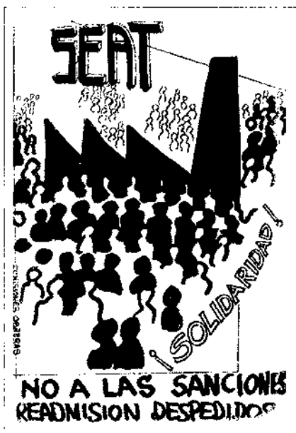
SEAT Amnistia. Cartell (1976). Arxiu Històric de la Comissió Obrera Nacional de Catalunya.

generals, en ocasions quasi immòbils, sobre els quals aquestes persones actuaven i responien individualment i col·lectivament als canvis en societat. Això hem intentat d'aconseguir-ho a partir de la situació dels protagonistes en dos espais físics i simbòlics, el barri i la fàbrica, que actuaren al mateix temps en la formació dels activistes, tots dos bàsics per explicar les seves relacions –que no acaben ni comencen en l'entrada al centre de treball– i que fins a cert punt imprimiren un caràcter de “sindicalisme de carrer” a les CCOO en els seus orígens i al llarg de molt de temps. Per altra banda, hem tractat de confeccionar “mapes” de les relacions d'aquests grups d'activistes a partir d'identificar i definir aquells nusos de les xarxes socials que els connectaven: barri, fàbrica, parròquia, centre social, sindicat vertical, associacionisme cultural i veïnal.