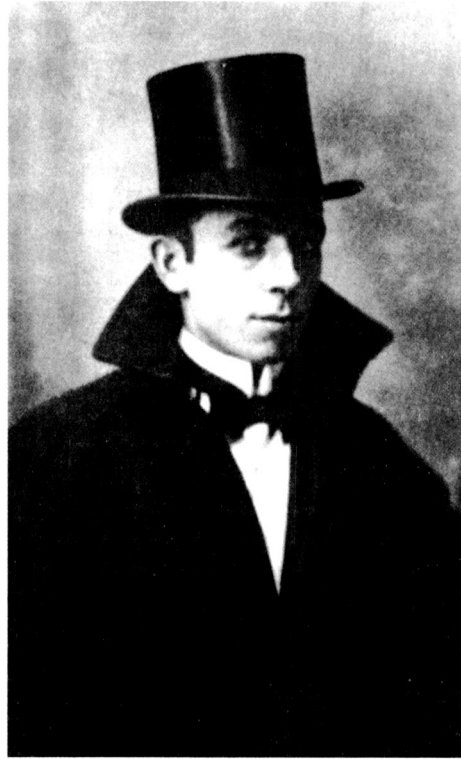
Pius Daví i Segalés (Moià, 1891 - Barcelona 1956).

com si volguéssim llençar-la als quatre vents i assabentar a tots els de fora (els quals resten as-torats de les respostes) que això del teatre català és una mentida que ens havíem inventat per l'afany de tenir de tot, com els pobles grans.