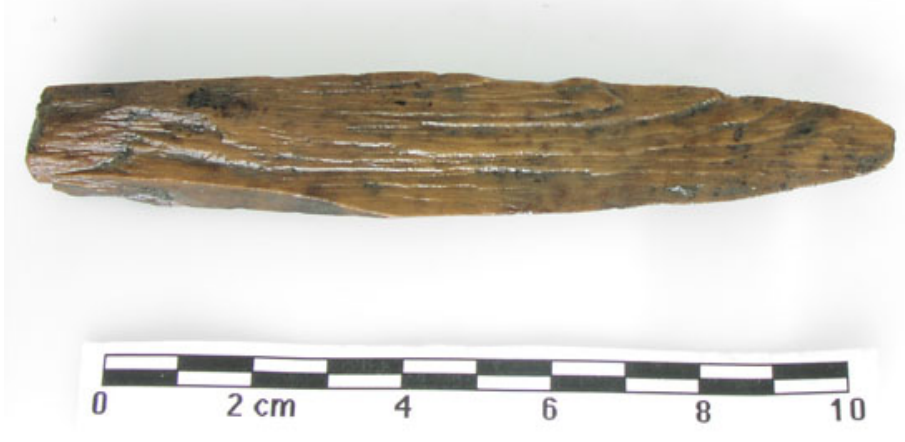
Figura 1. Fragmento de madera procedente del poblado neolítico de la Draga (Banyoles, Girona).

Otros contextos donde se puede conservar la madera son los ambientes muy secos, como los desérticos, ambientes donde la congelación es constante, como los glaciares o ciertas latitudes donde el suelo está permanentemente congelado. En ambos casos se trata de condiciones climáticas extremas, poco habituales en la península. Los restos de Ötzi, localizados en un glaciar de los Alpes austríacos, son un buen ejemplo. Al lado del cuerpo se localizaron un arco con sus flechas e instrumentos de madera, además de plantas utilizadas para diferentes fines (Bortenschlager y Oeggl, 2000.). También el contacto con ciertos elementos químicos inhibe la actividad bacteriana y favorece la conservación de la madera, así el contacto con ciertos metales ha permitido la conservación de restos de mangos adheridos a herramientas. Todos estos casos constituyen más bien la excepción, y son casos puntuales que generalmente no permiten, salvo algunas excepciones, obtener un buen conocimiento de las características de los paisajes en los que se obtuvieron las materias primas.