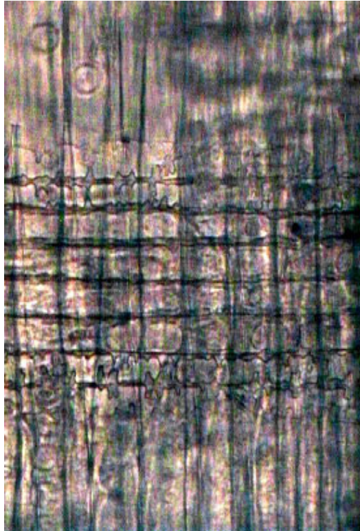
Figura 3. Plano radial de Pinus tipo sylvestris-nigra . Fotografía sobre lámina delgada extraída de un fragmento de madera procedente del pozo romano de Iesso (Guissona).

La determinación del género o especie a la que pertenecen los restos se efectúa por comparación con muestras de referencia actuales. Para ello, se confeccionan colecciones de referencia de material fresco y carbonizado, a ser posible con diversos individuos de cada especie de manera que esté representada la variabilidad en el seno de las diferentes especies. También se utilizan los atlas de anatomía de la madera que para el caso de Europa son bastante exhaustivos y completos. Entre las diversas publicaciones especializadas destacan las de Schweingruber (1978, 1990), recientemente también asequible en formato online (Schoch, et al. , 2004).