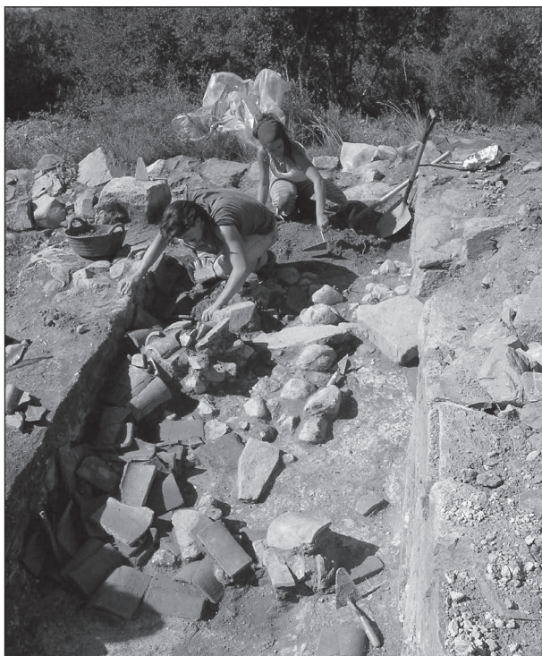
Figura 5. Vista del subàmbit 5 en la documentació de la barbacana caiguda.