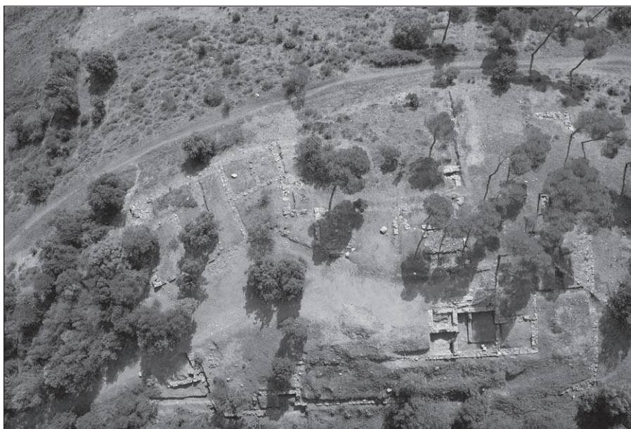
Figura 7. fotografia aèria del jaciment.

Tots els indicis apunten a que aquest castellum va tenir una existència força curta. Si ens plantegem els motius d'aquesta efímera durada podem proposar la següent hipòtesis: resulta lògic plantejar que en el moment en que en aquesta zona ja no era tan necessària la forta presència militar, la conseqüència més immediata sobre Can Tacó hauria estat que la funció exercida des d'aquest indret s'hagués traslladat a un altre enclavament més prioritari des del punt de vista militar, com ara zones de l'interior, o com a conseqüència de la fundació de noves ciutats, com Baetulo o Iluro .