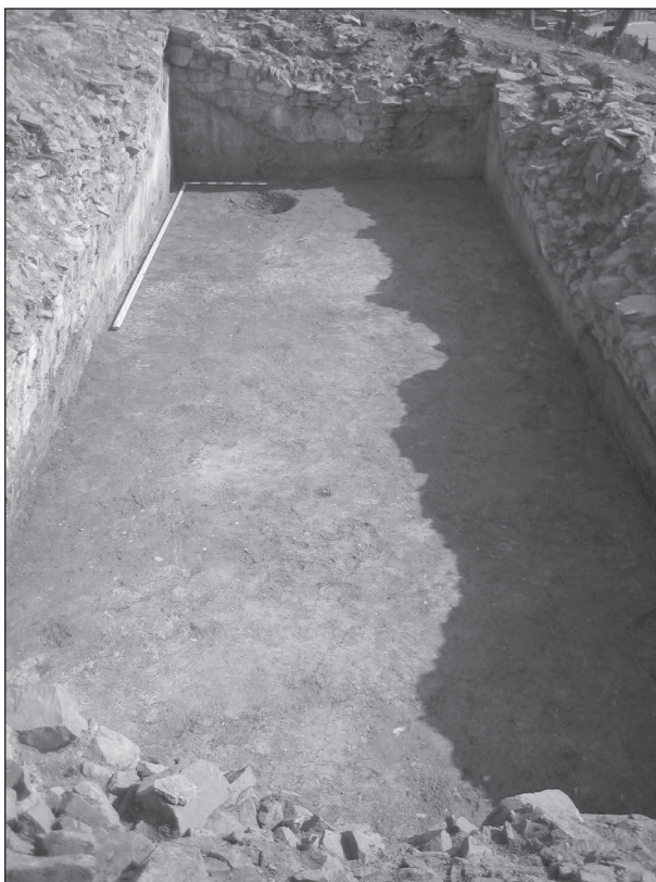
Figura 4. Vista general de la cisterna.

l'elaboració d' opus signinum . Aquesta habitació es troba compartimentada per un mur de tàpia que delimita dos subàmbits. En el més petit s'ha excavat un enderroc de teula que formaria una canalització en el sostre per facilitar la recollida d'aigües pluvials a mode de barbacana