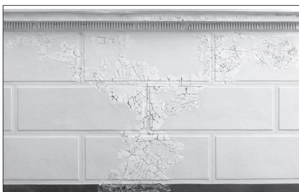
Figura 6. Fotografia de la motllura i l'estuc trobats a l'àmbit 5.

En aquest aspecte caldria esmentar que la part soterrada, segons els indicadors, formaria part de la zona de serveis i magatzems, mentre que la part superior, avui desapareguda, seria la zona luxosa, on possiblement estarien ubicades les dependències dels alts càrrecs.