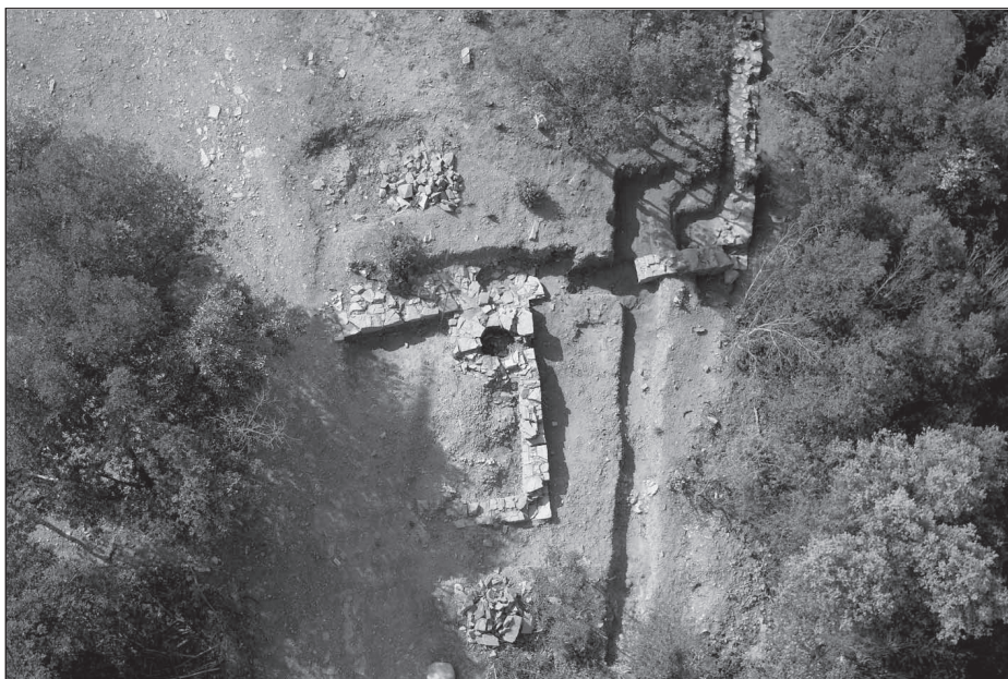
Figura 3. Cos defensiu avançat documentat en la campanya de 2006.

El dipòsit, que ha estat documentat en les campanyes realitzades en els mesos de juny i octubre del present any, s'ha pogut comprovar que té una dimensions aproximades de 9,00 metres x 3,60 metres i està totalment excavat. Posteriorment, s'han construït les quatre parets internes de contenció i s'han impermeabilitzat mitjançant un arrebossat d' opus signinum hidràulic. El paviment, que presenta el mateix acabat, fa una lleugera inclinació cap a l'angle suddest, on s'ha constatat l'existència d'una cubeta de decantació on es dipositaria la brutícia en suspensió.