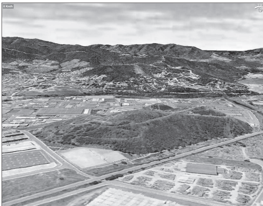
Figura 1. Vistes del turó de Can Tacó en primer terme i de la serra de Marina al fons