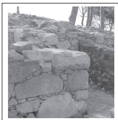
Figura 5.1. Foto on es pot apreciar el mur de tàpia que divideix l'àmbit 5 i la porta que comunica aquesta estança amb l'àmbit 12.