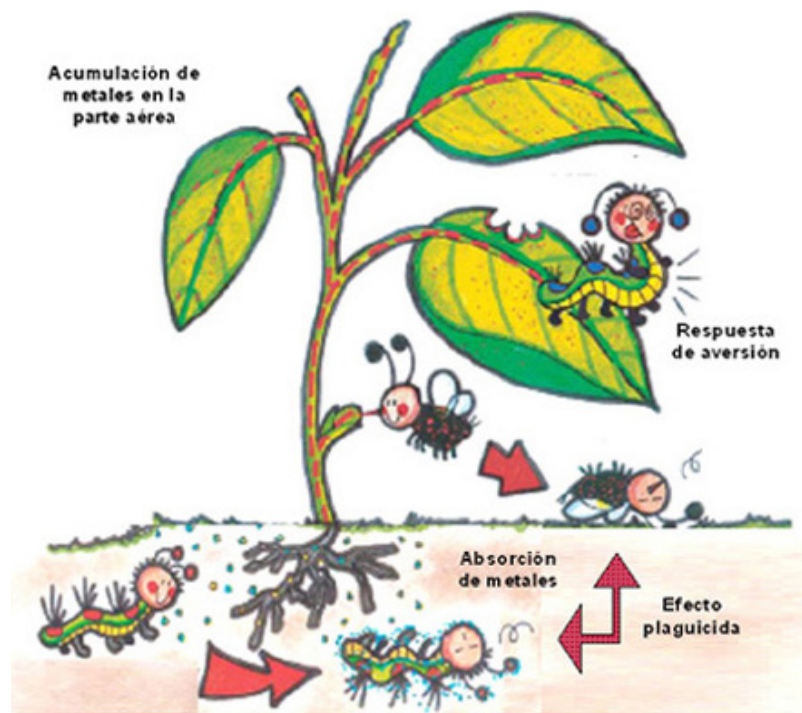
Figura 2. Respuestas de patógenos y herbívoros frente a la presencia excesiva de metales (modificado de Poschenrieder et al. , 2006).

Hay muy poca información de la influencia de un exceso de metales en la relación planta-patógeno. En algunos estudios se ha observado que los herbívoros que consumen plantas con altos contenidos en metal responden a su presencia viéndose afectados por su toxicidad (efecto plaguicida) o con una aversión posterior a la planta debido a su palatabilidad disuasiva (receptores del sabor) o por indigestión ( Fig. 2 ). Este aprendizaje asociativo reduce consecuentemente la intensidad del ataque. En otros trabajos realizados con caracoles (Noret et al. , 2005), la reacción de aversión no se observó hacia plantas con un alto contenido en Zn, sino a elevados niveles de glucosinolatos, moléculas relacionadas con el contenido del metal (Tolrà et al. , 2001). La disponibilidad de una elevada concentración de metales tóxicos puede tener, por lo tanto, un impacto positivo, negativo o nulo en el desarrollo del estrés biótico.