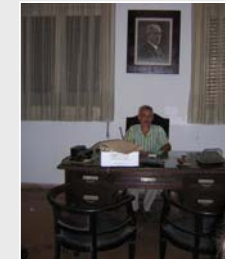
Fig. 7. Disfrutando de un merecido descanso.