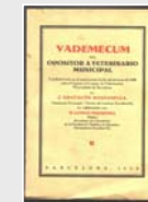
Fig. 9. Portada de uno de los libros de veterinaria recuperados.