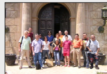
Fig. 10. Como no, todos.