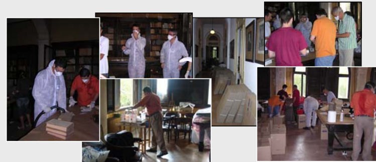
Fig. 5. Material necesario para la limpieza de ácaros y hongos: aspiradores, ropa adecuada, guantes y mascarillas, etanol, cajas de embalaje, y...muchas ganas de trabajar.