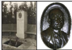
Fig. 1. Bustos conmemorativos de los fundadores del Institut Ravetllat-Pla. A la izquierda, busto de Joaquim Ravetllat, situado en los jardines del Instituto. A la derecha, imagen de Ramon Pla que se encuentra en la pared del despacho de dirección de los laboratorios.

Joaquim Ravetllat i Estech (1871-1923) (fig. 1), veterinario gerundense, estudió y trabajó en la tuberculosis a finales del siglo XIX y principios del XX, desarrollando una teoría sobre la etiología bacteriana de la enfermedad. Junto con el médico Ramon Pla i Armengol (1880-1958) (fig. 1) fundaron el Institut Ravetllat-Pla (fig. 2), un laboratorio farmacéutico de Barcelona especializado en el estudio y la elaboración de fármacos para tratar la tuberculosis.