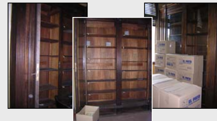
Fig. 8. Aspecto de las estanterías una vez vaciados y embalados los libros y revistas.