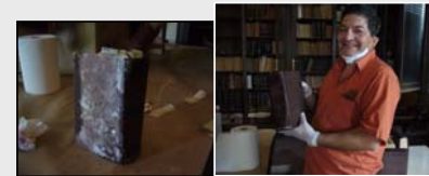
Fig. 6. El antes (izquierda) y el después (derecha).