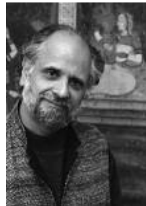
Homi K. Bhabha

L'estudi de les categories socioculturals referides a mescles no es limita als mestissatges a Hispanoamèrica; 6 tenen el seu paral·lel en els conceptes d' hibridació i creolització per al món colonial i postcolonial angloamericà i caribeny, respectivament. Procedent de la biologia, la hibridació formava part durant els segles XVIII i XIX de l'instrumental argumentatiu racista que pretenia advertir dels efectes nefastos de la mescla de races. 7 En la darrera dècada del segle XX, la hibridació adquirí un nou esclat acadèmic, amb signe anticolonial, en el gir paradigmàtic postcolonial i la seva crítica de l'imperialisme cultural, que té molt a veure amb el culturalisme analític dominant en la societat i en l'acadèmia durant les darreres tres dècades. La teorització de la hibridació es desenvolupà en dues etapes: el pioner Homi Bhabha examinà els efectes que l'ambivalència provocada per la hibridació colonial tingué per a les elits colonials com a forma cultural en socavar l'autoritat del seu poder. 8 Malgrat el seu antiessencialisme, aquest enfocament presenta les mateixes dificultats conceptuals que la noció de mestissatge , en suposar identitats preexistents pures. Tot i que en una segona etapa la concepció d' hibridació transcendeix les categories racials i ètniques colonials i postcolonials i replanteja el dilema central de les ciències socials de com comprendre la interacció entre sistemes simbòlics i acció social, tampoc no solu-