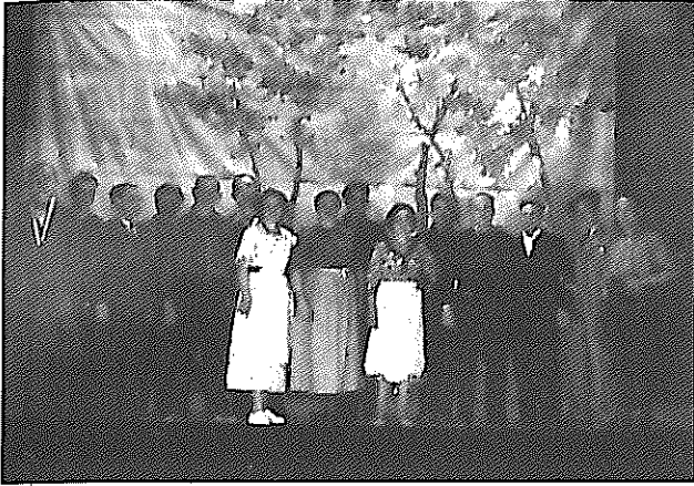
Estrena de la peça dramàtica de Joan Baptista Xuriguera La pau regna al camp al Teatre Victòria de Lleida el 15 de desembre de 1936.

de la vida moderna. Com apunta en el pròleg de Capses humanes , l'automatisme ha fet canviar els humans que, en lloc de moure's per ideals col·lectius, es deixen emportar per la velocitat i el gaudi immediat i perden la noció del seny i de l'equilibri.