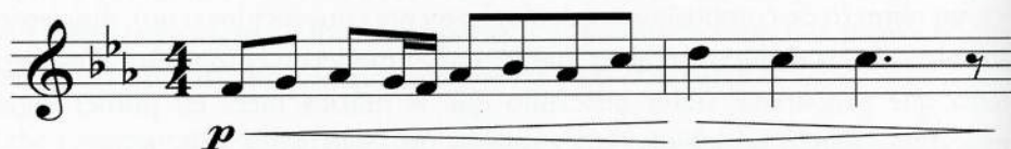
Imagen 1. Prokofiev. Alexander Nevsky Film Music. (Take 20, c.21).

Si se hace una reducción de la melodía, la escala resultante es una escala dórica: