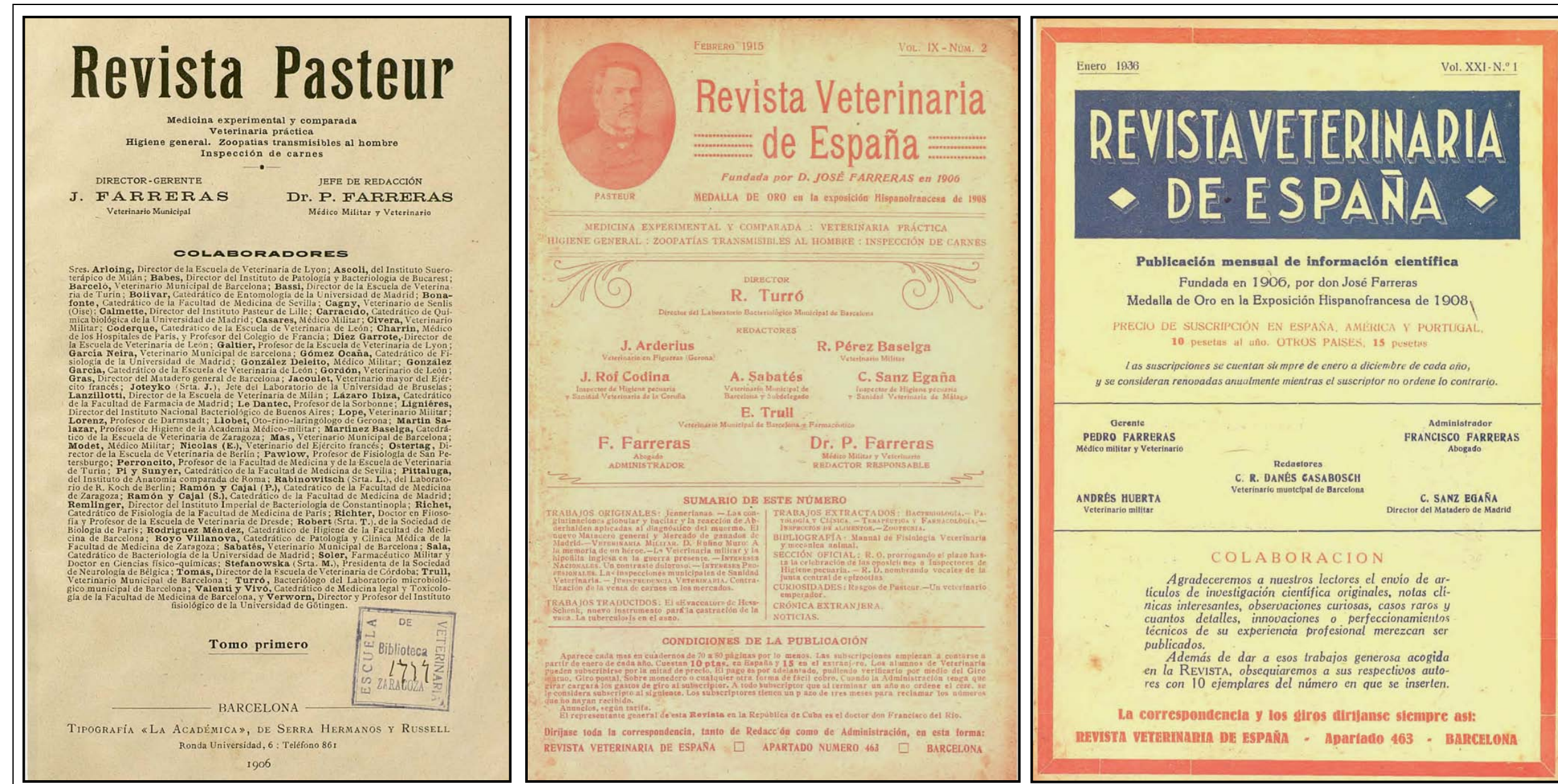
Fig. 2. Portada del primer número de la Revista Pasteur (1906), del primer número con el cambio de nombre a Revista veterinaria de España (1907), y del último número publicado en el año 1936.