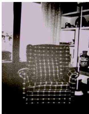
Imagen 3. La abuela

Siempre veo la muerte como algo lejano, la vida como algo largo y por aprender. Su vida, en cambio, se apaga. Lo veo en su cansancio, aunque sé que aún queda un poco de tiempo. Y yo puedo decir, sin miedo alguno, que estoy orgullosa de ser de su sangre y que jamás la voy a olvidar.