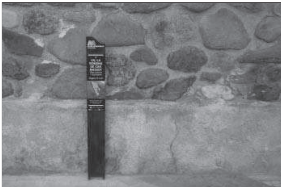
Figura 1. Exemple de senyalització corresponent a un mur de la vil·la