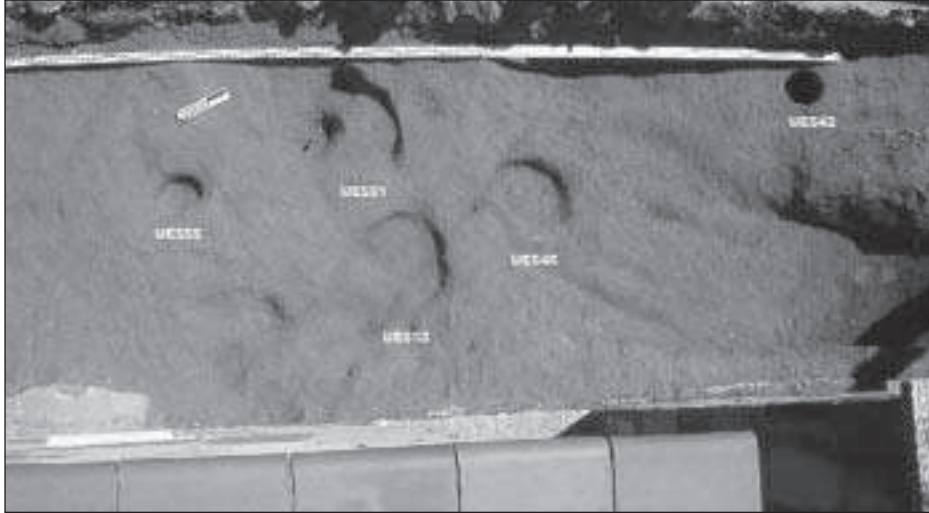
Figura 6. Imatge del conjunt de dos forats de pal i tres petits retalls