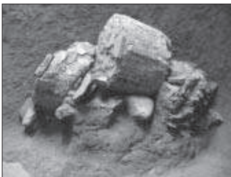
Figures 9 i 10. A la imatge de l'esquerra, detall del paviment de l'àmbit 2, i a la de la dreta, fragments de fusts documentats en el farciment de la sitja 1

De l'ala meridional s'han pogut resseguir molt parcialment dues estances, molt afectades per les espoliacions i els rebaixos continus produïts des d'època antiga fins al segle XX. L'àmbit 4 presenta una superfície rectangular d'una llargària de 5,45 m i similar a l'àmbit 5 per una possible amplada de 3,46 m, malgrat que els límits físics de