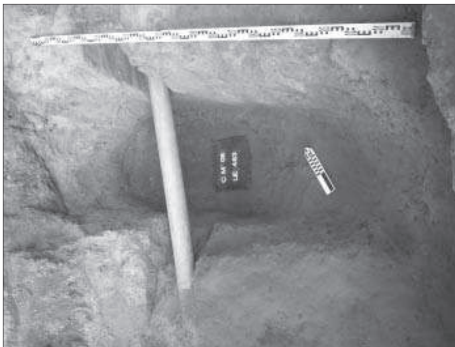
Figura 4. Imatge de l'estructura de combustió

devia funcionar com un dels seus fonaments, és a dir, com a suport d'estructures aèries, que els tres retalls eren els forats de pal corresponents, que formaven una cantonada, i que la fossa devia servir per farcir-los amb terra amb la finalitat de faltar-los i assegurar-ne millor l'estabilitat. Per altra banda, podria tractar-se d'un tipus d'estructura d'emmagatzematge, en la qual els tres petits retalls servien de suport de vasos contenidors de grans dimensions, atès que s'han trobat diversos fragments ceràmics en el seu interior.