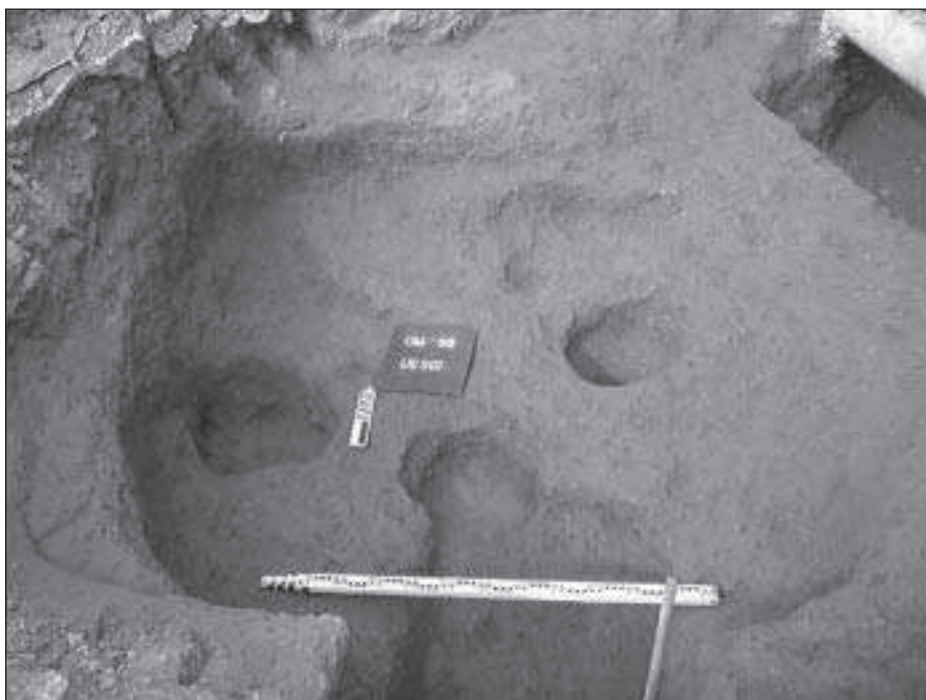
Figura 5. Imatge de la fossa de grans dimensions