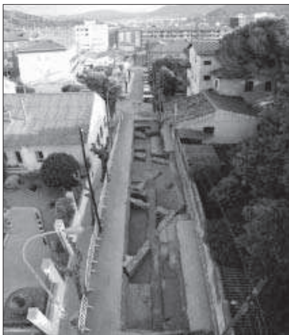
Figura 8. Vista panoràmica de les estructures documentades l'any 2007 sota el subsòl del carrer Mossèn Jacint Verdaguer

L'edificació s'ubica a la vessant meridional del turó de la Bandera i s'orienta cap al sud-est, en un terreny amb lleuger pendent, fet que es palesa en les fonamentacions dels murs que s'adapten a les irregularitats naturals. Els treballs portats a terme fins ara han permès destapar parcialment un seguit d'estances distribuïdes al voltant d'un atri, que corresponen a les ales occidental i meridional (Fig.7, núm. 1-5), juntament amb una estructura semicircular situada al nord-oest d'aquest cos (Fig. 7, núm. 6). A uns 50 m a l'est s'han localitzat dos murs que devien formar la cantonada d'una dependència i una sitja (Fig. 7, núm. 7 i sitja 2) i finalment a la part sud i sud-est apareixia un mur perimetral i una altra sitja (Fig.7, núm. 8 i sitja 1).