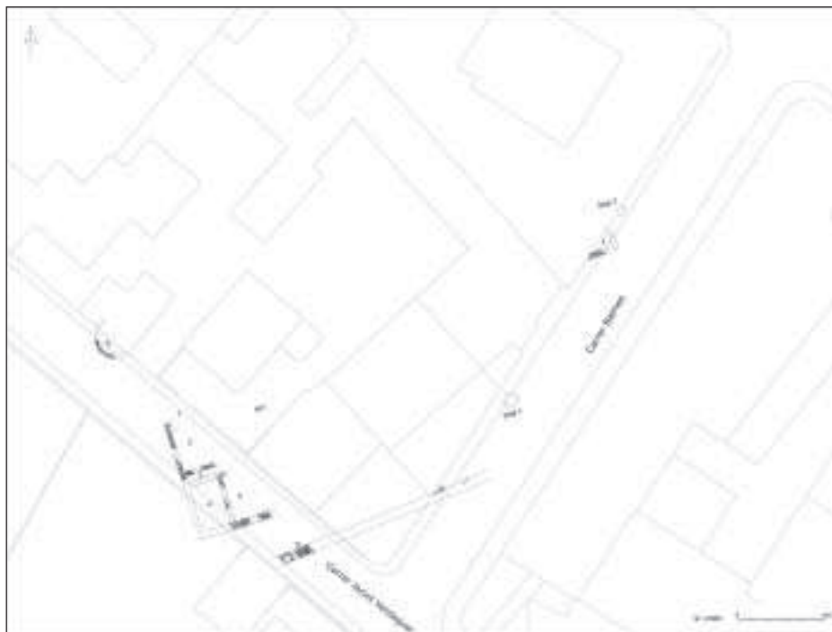
Figura 7. Estructures documentades durant les darreres intervencions

Cantarell 4 durant la segona meitat del segle xx. La zona d'actuació que ha donat resultats positius comprèn la via pública del carrer Mossèn Jacint Verdaguer, des de la casa número 20 fins a gairebé la cruïlla amb el carrer Balmes, i el primer tram d'aquest últim. Així doncs, els vestigis documentats fins al moment permeten afirmar que almenys les restes constructives es localitzen en el subsòl d'una extensa àrea situada entre tres de les illes de cases que donen als carrers Jacint Verdaguer i Balmes. La part excavada per nosaltres estava molt alterada pels rebaixos de terres produïts des de l'època antiga fins a la segona meitat del segle xx, fet que es feia especialment evident en els murs on en alguns casos tan sols quedaven les últimes filades de fonamentació, quan no havien estat completament espoliats. En canvi, les restes destapades per Ignasi Cantarell al subsòl de l'actual casa núm. 18 del carrer Jacint Verdaguer es documentaven en un estat de conservació molt millor.