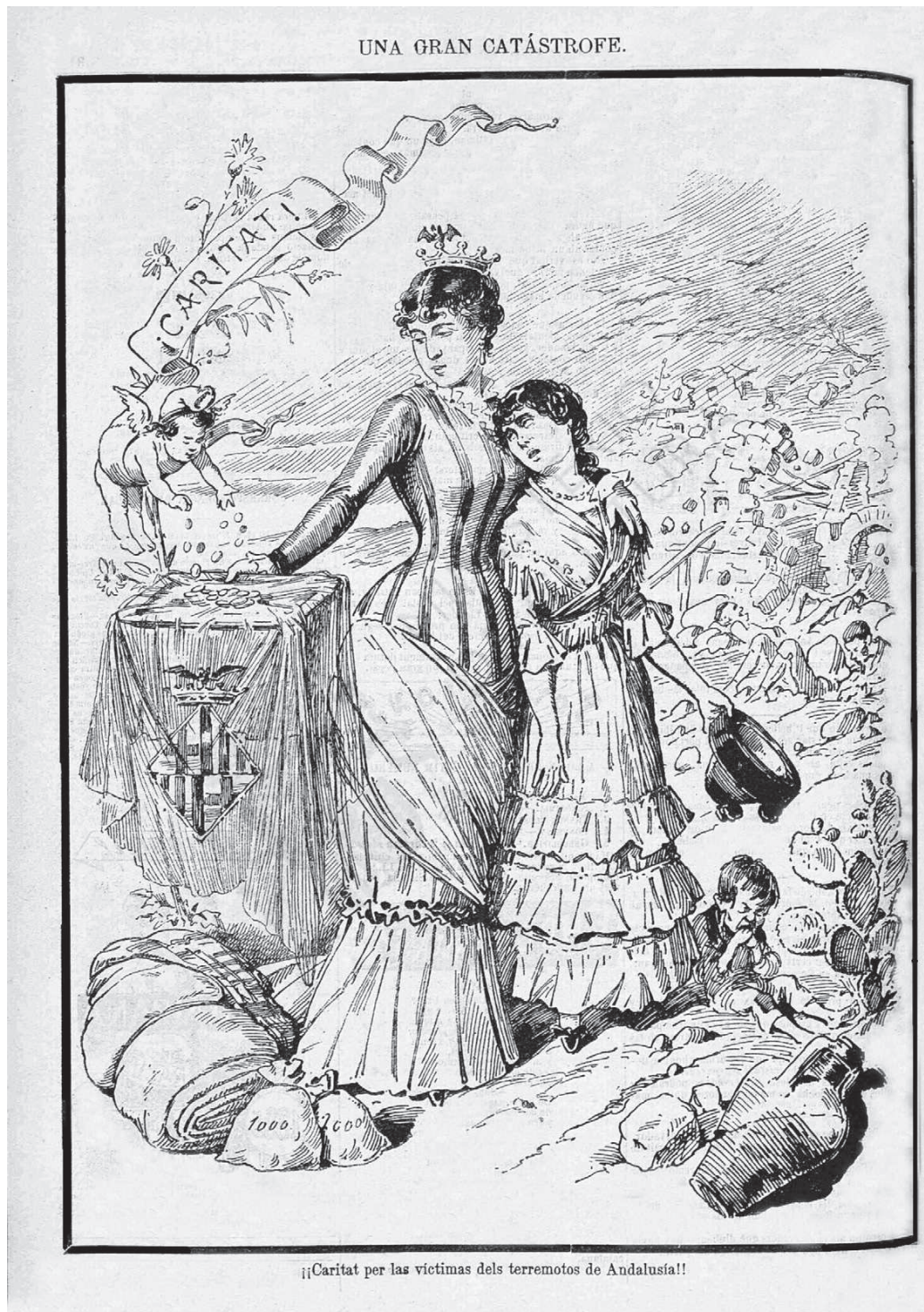
«Una Gran Catàstrofe». «¡¡Caritat per les víctimes dels terratrèmols d'Andalusia!!». La Campana de Gràcia , 11 de gener de 1885.

Els republicans també reaccionaren d'immediat davant les primeres notícies arribades a Barcelona sobre els terratrèmols d'Andalusia. En el dibuix destaca la figura iconogràfica de Barcelona, una senyora jove, ben arreglada i elegant, però en absolut distant, que, acollidora, impulsa la solidaritat i abraça l'adolorida noieta andalusa, que duu un vestit de ressos folklòrics, amb un nen famèlic als peus.