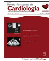
IMAGEM EM CARDIOLOGIA