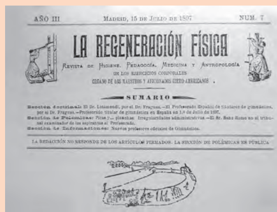
Capçalera de la primera pàgina de La Regeneración Física , 1897

Abans d'arribar al boom dels anys vint, Narciso Masferrer citava que la gegantina feina de propaganda esportiva ja estava donant sorprenents fruits (Navarro, 1916). En pocs anys s'esmentava que els diaris i revistes esportius s'havien multiplicat extraordinàriament ( Madrid-Sport , 1919). En aquest context, en el qual l'esport va marcar un domini de l'educació física, facilitat per sectors pedagògics influents com la