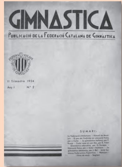
Gimnàstica, núm. 2 segon trimestre de 1934