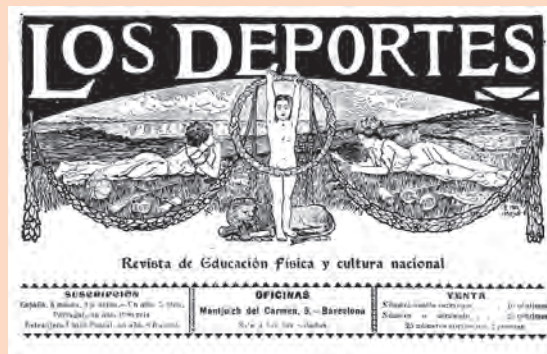
Capçalera de la revista Los Deportes , 1904