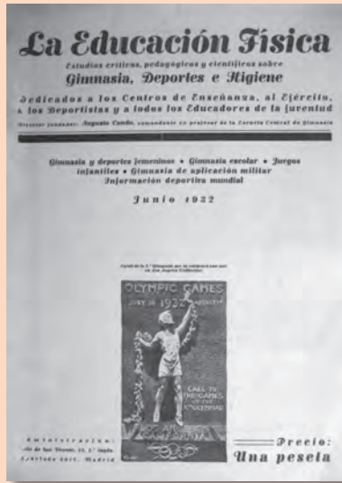
La Educación Física, núm. 1, juny de 1932