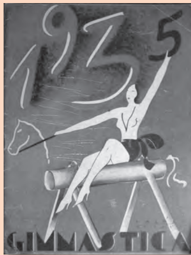
Portada de la revista Gimnàstica, abril de 1935