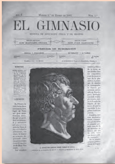
El Gimnasio, núm. 1, 1 de febrer de 1882