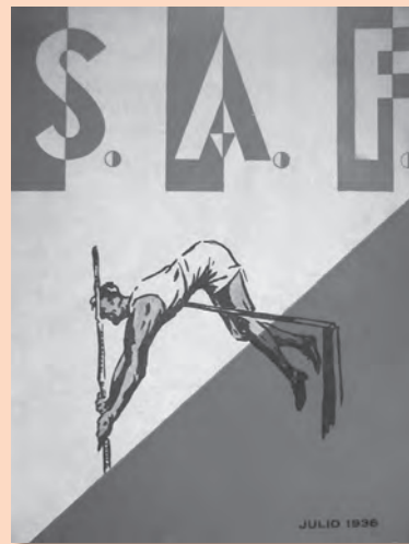
Revista S. A. F., núm. 26, juliol de 1936