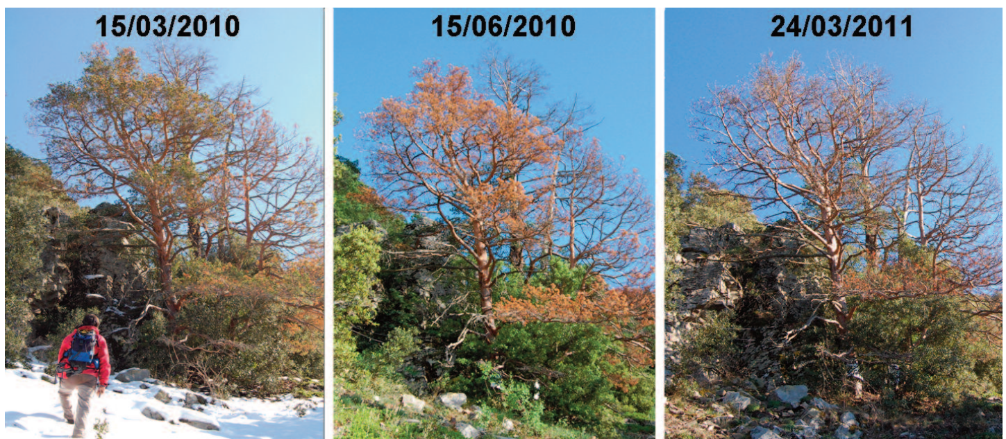
Figura 2. Secuencia de fotografías de un pino albar muriendo en las montañas de Prades (Tarragona).

Es importante considerar también que la respuesta del crecimiento al clima depende de la edad de los pinos. Bogino et al. (2009) encontraron que las variables climáticas explicaban una mayor proporción de la variabilidad en el crecimiento en los pinares jóvenes. En otro estudio reciente, mostramos que los árboles de mayor edad presentan una menor resiliencia ante un episodio de sequía extrema (Martínez-Vilalta et al. 2012). En este mismo trabajo se constata también que los individuos de crecimiento más rápido se ven proporcionalmente más afectados por la sequía y, aunque su velocidad de recuperación es también mayor, tardan más tiempo en recuperar las tasas de crecimiento previas al episodio. Los efectos de las características de la parcela fueron menores que los de los atributos individuales y, en general, indicaron que la elevada competencia por los recursos empeora los efectos de la sequía en el crecimiento del pino albar (Martínez-Vilalta et al. 2012).