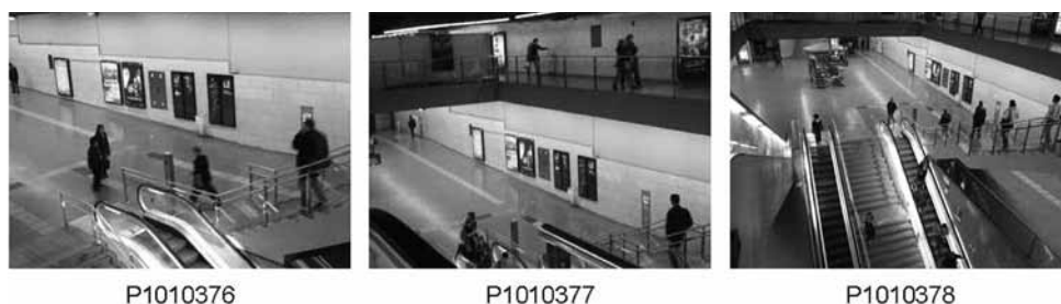
Figura 5. Detalle fragmento de diario de campo expuesto en imagen 4