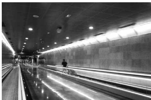
Figura 3. Múltiples cámaras de videovigilancia dispuestas de manera visible